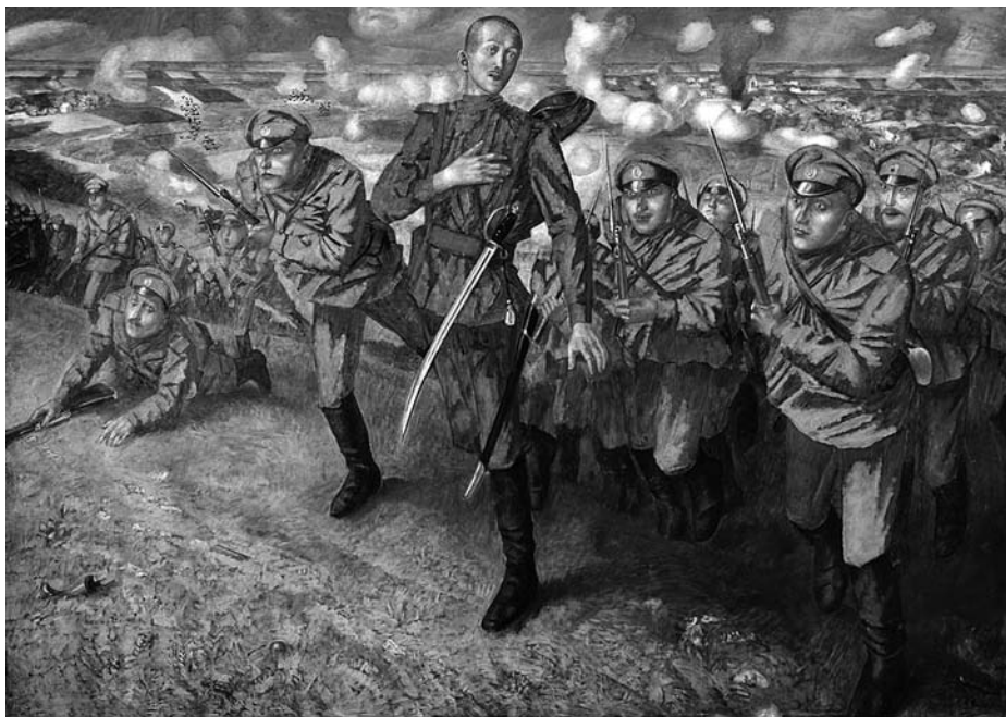
«На линии огня». Художник К. С. Петров-Водкин. 1916 год

откровенная пародия на «Пиковую даму» — игра по своим правилам является азартной, и снова цитируется (на этот раз Чарнотой) оперная баллада Томского, издевательски обращенная к Парамону: «Получишь смертельный удар ты... три карты, три карты, три карты...» 5 . Наконец, принципиально то, что композиционным центром пьесы Булгакова является пятая картина — «Тараканьи бега в Константинополе». Выживает тот, кто существует по законам вероятностного мира — эта идея в пьесе является одной из ведущих. Выживает Чарнота, выживает хозяин тараканьего балагана, к которому Чарнота обращается со словами: «Смотрю я на тебя и восхищаюсь, Артур. Вот уж ты и во фраке. Не человек ты, а игра природы — тараканий царь. Ну и везет же тебе!» Выживает Корзухин при всем его аморализме — он тоже игрок, на чем и будет «поддет» в седьмой картине Чарнотой: «Э, Парамоша, ты азартный! Вот где твоя слабая струна!»