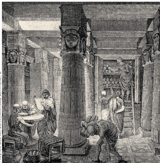
Рисунок: Otto von Corvin/Wikimedia Commons/PD

В средневековых монастырских книгохранилищах составлялись каталоги в виде толстых книг. Самые сообразительные монахи-библиотекари не просто записывали книги в порядке поступления, а вели тематические каталоги, отводя на каждую тему несколько страниц или даже отдельный том. Эти книги часто приковывали цепями к стене, чтобы их не уносили. Предосторожность, нелишняя и в наше время. В Ленинской библиотеке (ныне Российской государственной) читательский каталог много десятилетий состоял из рядов больших каталожных шкафов с выдвигаемыми ящичками, набитыми карточками с названиями и шифрами. Ежемесячно из