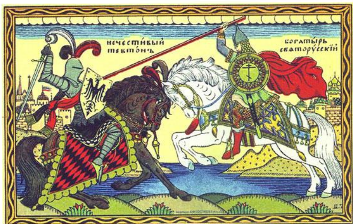
Патриотический плакат времён войны

Отдавая должное несомненному дару предвидения, трудно согласиться с основным выводом автора. Документы из немецких архивов, с которыми имел возможность ознакомиться и автор этих строк, неопровержимо свидетельствуют, что Германия сама выбрала экспансию на Восток. Её стратегия предусматривала отторжение от Российской империи значительной территории западных губерний и навязывание ей крайне невыгодного, если не сказать кабального, торгового договора.