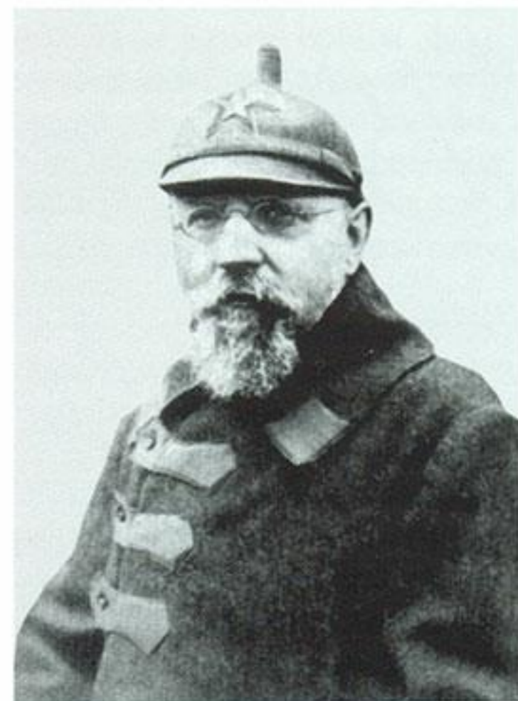
М. Н. Покровский. Фотография 1920-х годов

Первый глава советского исторического сообщества пошёл куда дальше Ленина, признававшего равную ответственность всех империалистических держав за развязывание Первой мировой войны. И его версия была удобным оправданием позиции большевиков, с первых дней войны взявших курс на «превращение империалистической войны в войну гражданскую»: источником всех бед и невзгод военного лихолетья объявлялся царизм.