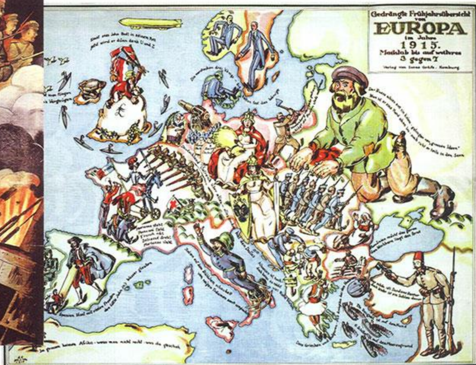
Немецкая сатирическая карта Европы. 1915 год

Российская, Германская, Австро-Венгерская и Османская — прекратили своё существование.