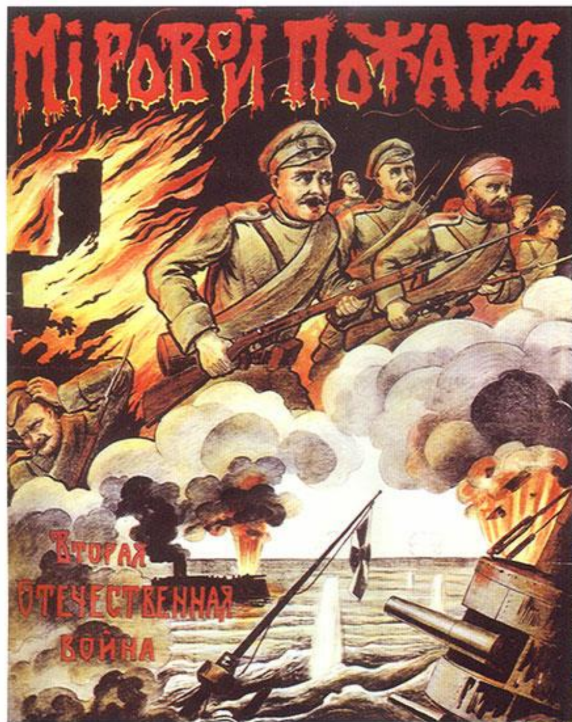
Российский плакат начала войны