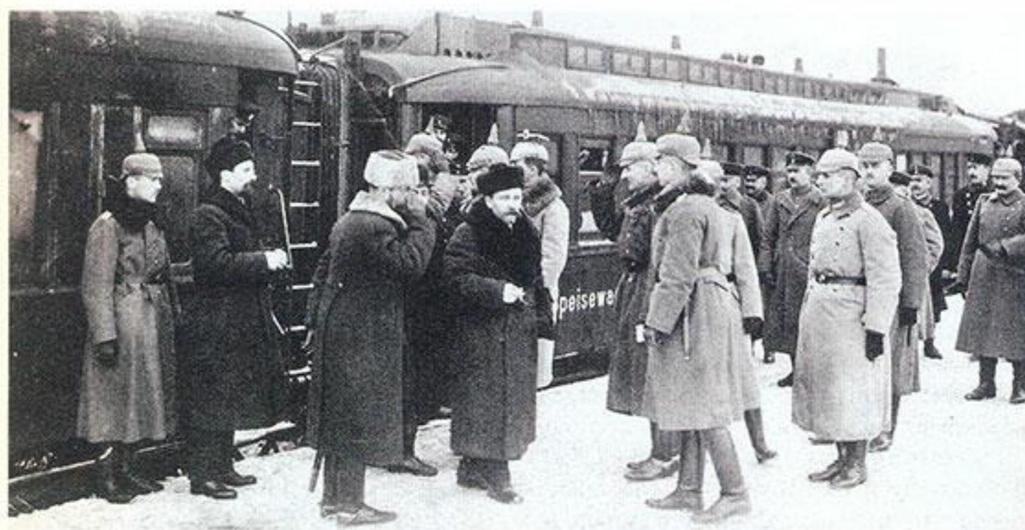
Офицеры штаба Гинденбурга встречают на перроне Бреста прибывшую делегацию РСФСР. 1918 год