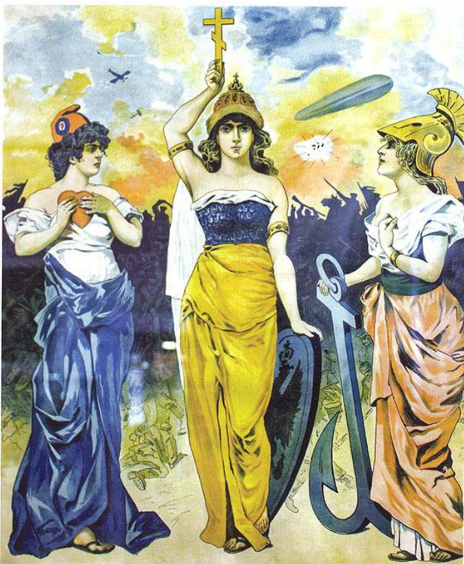
Российский плакат, посвящённый блоку Антанты. 1914 год