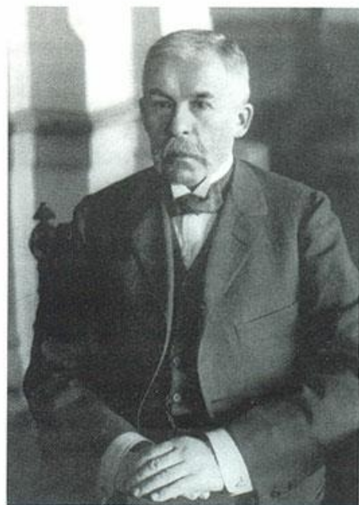
П. Н. Дурново

Начало войны в России было отмечено патриотическим подъёмом, но в целом страна «избежала той волны