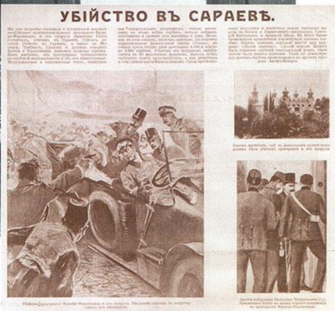
Фоторепортаж об убийстве в Сараево эрцгерцога Фердинанда. Журнал «Искры». 1914 год

В этом году многие европейские столицы отмечают 100-летие с начала Первой мировой войны. При солидной финансовой и моральной поддержке правительств исторические музеи в Лондоне и Париже, Вене и Берлине готовят новые экспозиции, маститые историки завершают монументальные труды. Открытые источники позволяют дать новые ответы на старые вопросы: что вызвало мировой конфликт, кто виноват в его разжигании, можно ли было его предотвратить, какие цели ставили перед собой участники противоборствующих коалиций?