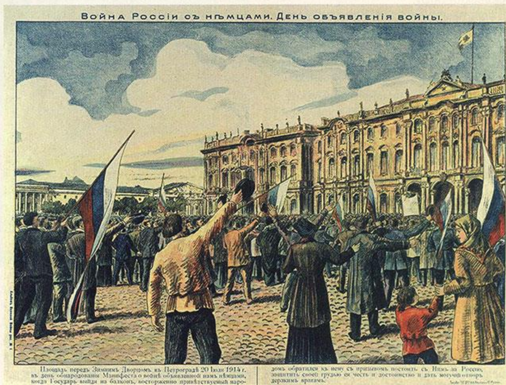
Война России с немцами. День объявления войны. Плакат. 1914 г.

Те, кто остался в тылу, активно включались в благотворительную деятельность,