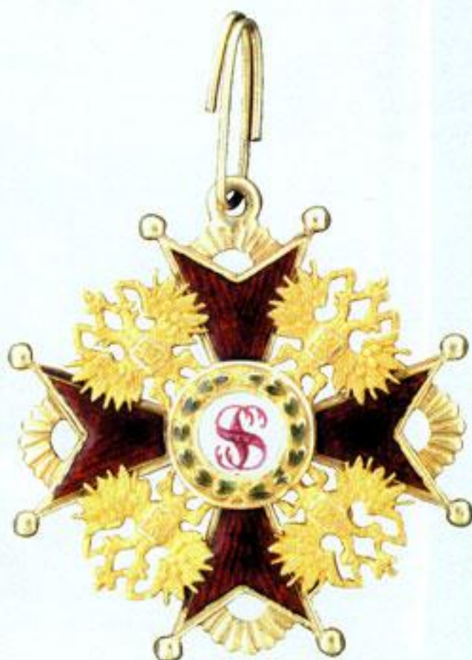
Знак отличия за военные достоинства 4-й степени.