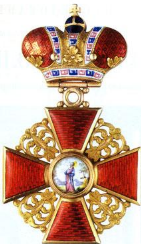
Орден св. Анны 2-й степени с императорской короной.

Если с серебряными медалями, которыми награждён подполковник Генерального штаба, всё ясно (медали даны за непосредственное участие офицера в двух победоносных войнах), то наличие на его мундире тёмно-бронзовой медали «В память Отечественной войны 1812 года» требует комментария. Судя по возрасту молодого офицера, он вряд ли мог быть участником этой войны. Почему же мы видим на его груди «дворянскую» медаль на Владимирской ленте? Эта медаль была учреждена Манифестом императора Александра I от 30 августа 1814 года. Медаль на Владимирской ленте предназначалась для награждения глав дворянских родов, даже если они не принимали непосредственного участия в Отечественной войне и Заграничных походах. Манифест гласил: «Сию бронзовую... медаль да возложат на себя отцы или старейшины семейств, в которых, по смерти носивших оную, остаётся она в сохранении у потомков их, яко знак оказанных в сём году предками их незабвенных заслуг Отечеству...» Потомки тех, кто был награждён