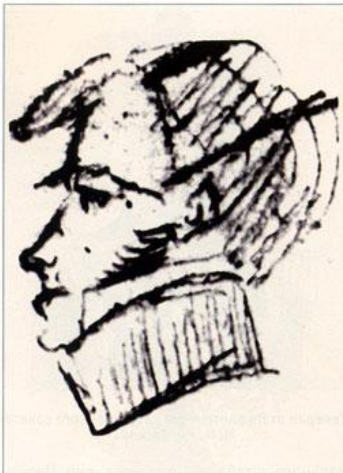
Прапорщик Свиты Е.И.В. по квартирмейстерской части М. М. Роговской. Рисунок А. С. Пушкина на листе с черновиками послания «Генералу Пушину», рядом с портретами генерал-лейтенанта И. Н. Инзова. Инзов — главный попечитель и председатель Комитета об иностранных поселенцах южного края России, к канцелярии которого был прикомандирован высланный из Петербурга Пушкин. Прапорщик нарисован без усов, ибо при Александре I усы было разрешено носить только офицерам лёгкой кавалерии. Рисунок впервые опубликован в книге Т. Г. Цявловской «Рисунки Пушкина» (М. 1980. С. 284) как «И. Н. Инзов и неизвестный офицер».