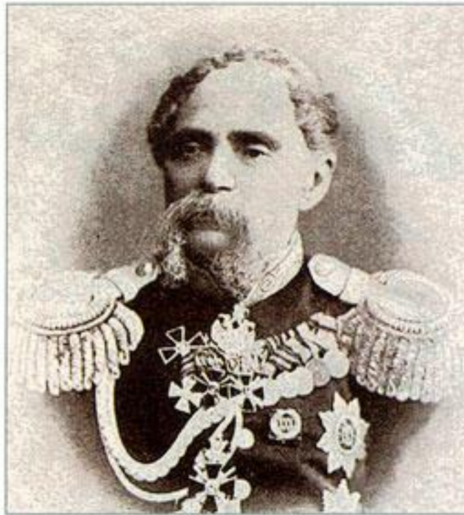
Генерал от инфантерии и член Военного совета М. М. Роговской.

Прежде всего я обратился к «Месяцеслову и общему штату Российской империи» и просмотрел это издание за 1836, 1837 и 1838 годы. «Месяцеслов», или «Адрес-календарь», являлся официальным изданием, содержал общую роспись всех военных и гражданских чиновных особ Российской империи, включая подробные сведения обо всех орденах, медалях и иных отличиях, имевшихся у этих чиновников. Однако если военный не принадлежал к чином государственной Свиты, не числился в рядах одного из полков лейб-гвардии или не состоял в штате центрального аппарата Военного министерства, то фамилии этого военного чиновника могло не оказаться в этом справочнике. Я не нашёл в «Месяцеслове» ни одного подполковника Генерального штаба, отмеченного знаками отличия, подобными тем, что были у портретируемого офицера 3 . Это означало лишь одно: в указанные годы подполковник служил не в центральном аппарате Военного министерства и гене-