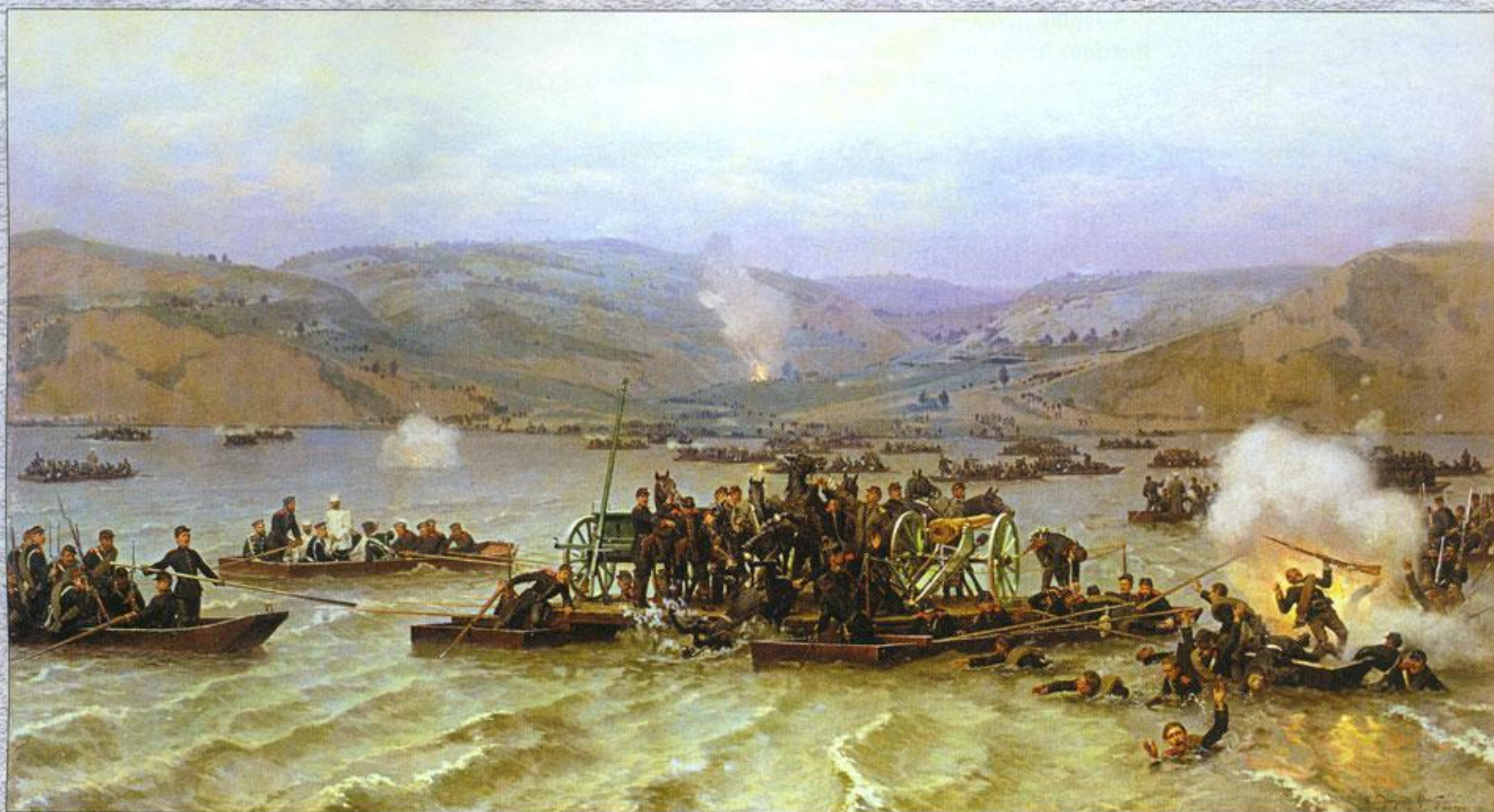
Переправа русской армии через Дунай у Зимницы 15 июня 1877 года. Художник Николай Дмитриев-Оренбургский. 1883 г. Военно-исторический музей артиллерии, инженерных войск и войск связи. Санкт-Петербург.

степени, затем золотым Георгиевским оружием — шпагой с надписью «За храбрость» — и досрочно произведен в полковники.