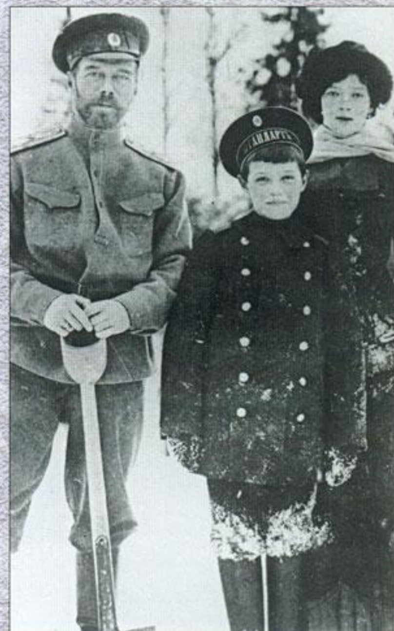
Император Николай II с сыном Алексеем и дочерью Марией. Фото 1916 г.

шее». Впрочем, авторитет Николая Николаевича мало пострадал от такого перемещения, а Земский съезд 1915 г. (форум представителей всех сословий) даже титуловал его «славным былинным богатырем».