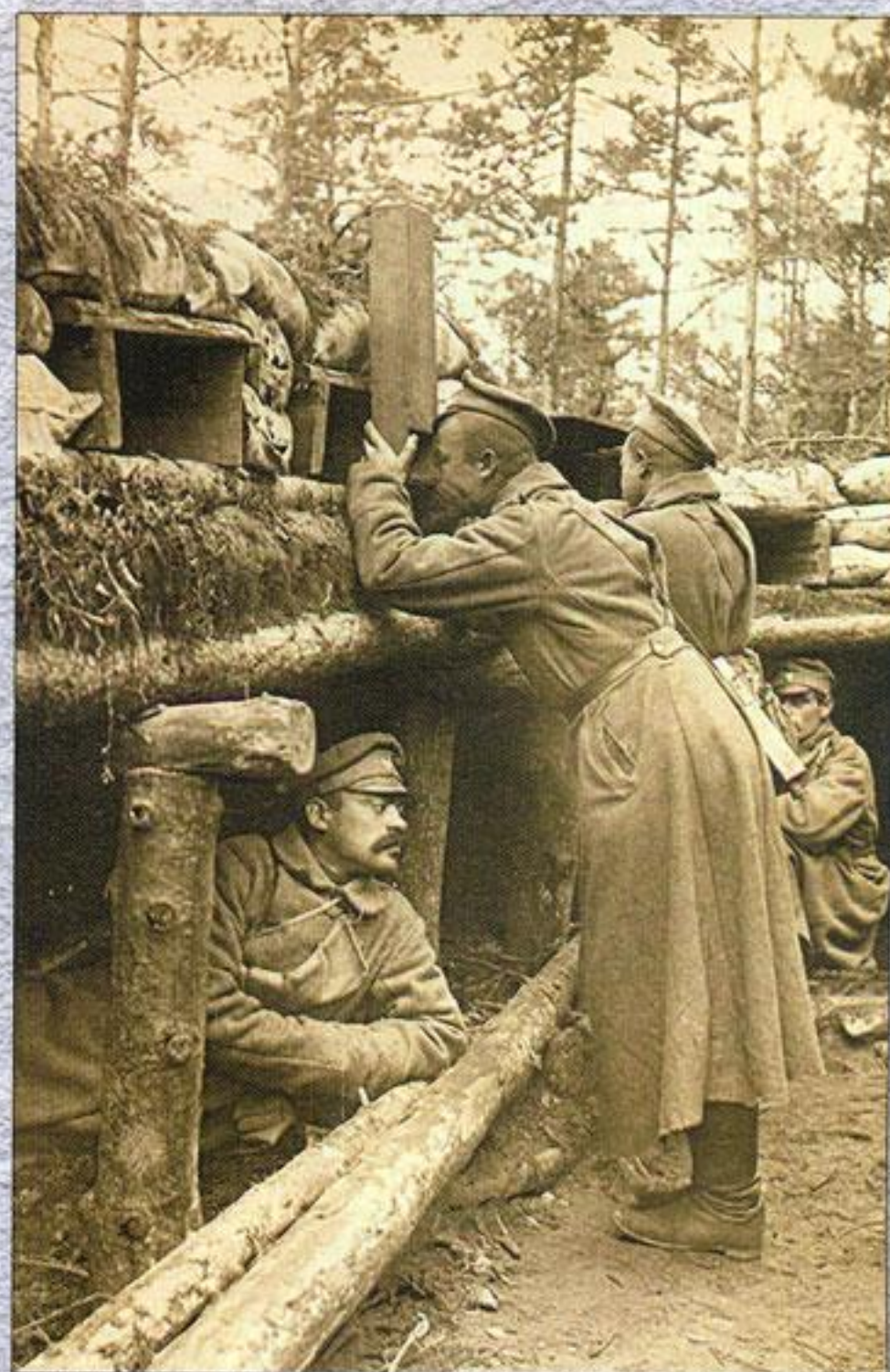
На передовых позициях (снято в 100 шагах от германских окопов). Фото 1915 г.

(6 августа—13 сентября), одной из наиболее масштабных в первом глобальном конфликте XX в. Затем великий князь сосредоточил внимание на Варшавском и Краковском направлениях, верно определив, что неприятель постарается нанести удар именно оттуда, и направил в район средней Вислы основные силы Юго-Западного и часть войск Северо-Западного фронтов (почти половину всей русской действующей армии). Это наступление, именуемое Варшавско-Ивангородской операцией (15 сентября — 26 октября) и ставшее успешным для наших войск, вошло в число крупнейших битв Великой войны и развеяло миф о непобедимости германской армии.