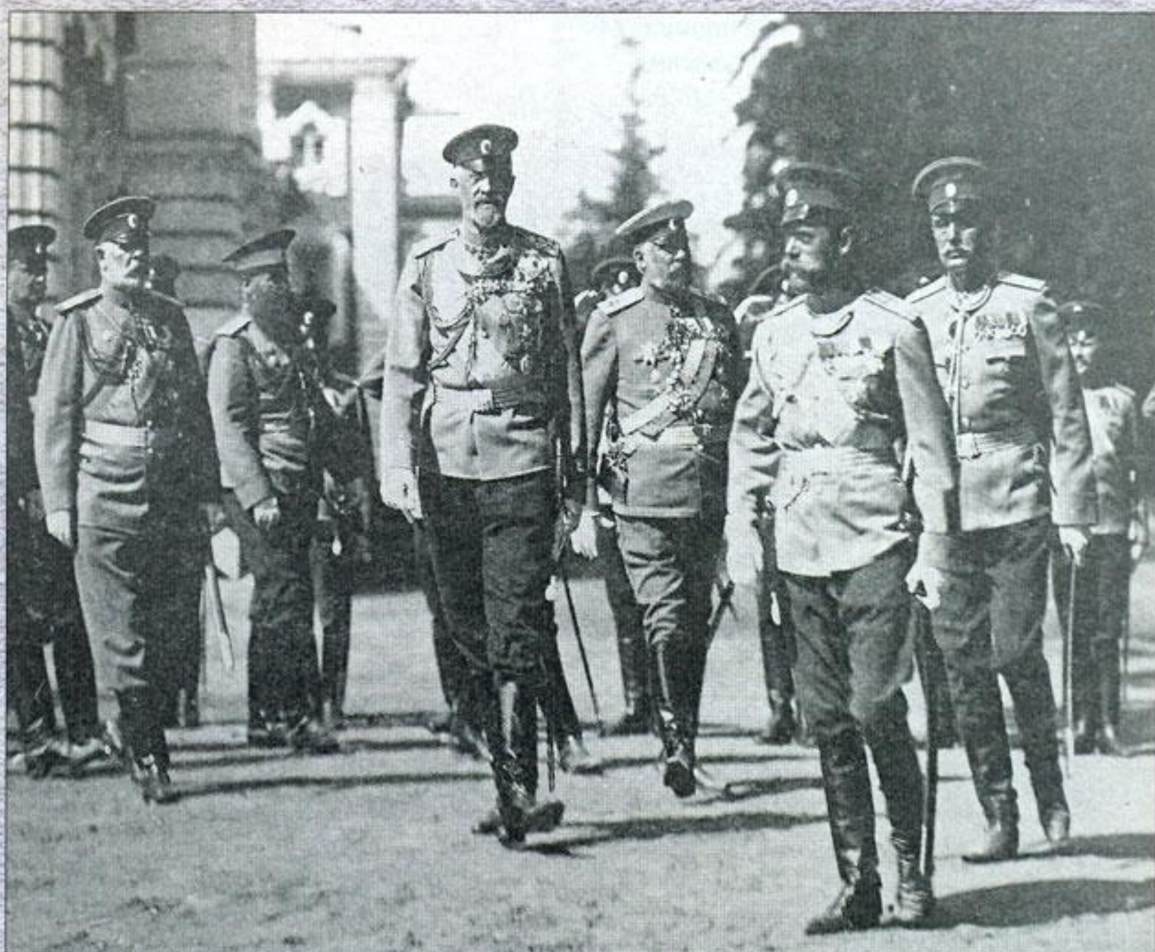
Николай II и Николай Николаевич-младший на параде. Фото «отца российского фоторепортажа» Карла Буллы. 1913 г.