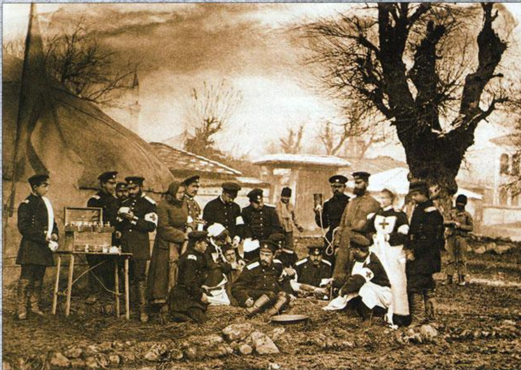
Передвижной госпиталь при русской армии. Фото 1877–1878 гг.

ского штаба, генералы-инспекторы всех родов войск (по традиции, великие князья), возглавил же новую структуру сам инициатор ее учреждения. Одной из важнейших задач Совета стала кадровая, в частности замена посредственных генералов, показавших свою профессиональную несостоятельность на полях Русско-японской войны 1904–1905 гг., кандидатурами, рекомендованными специально сформированной Высшей аттестационной комиссией.