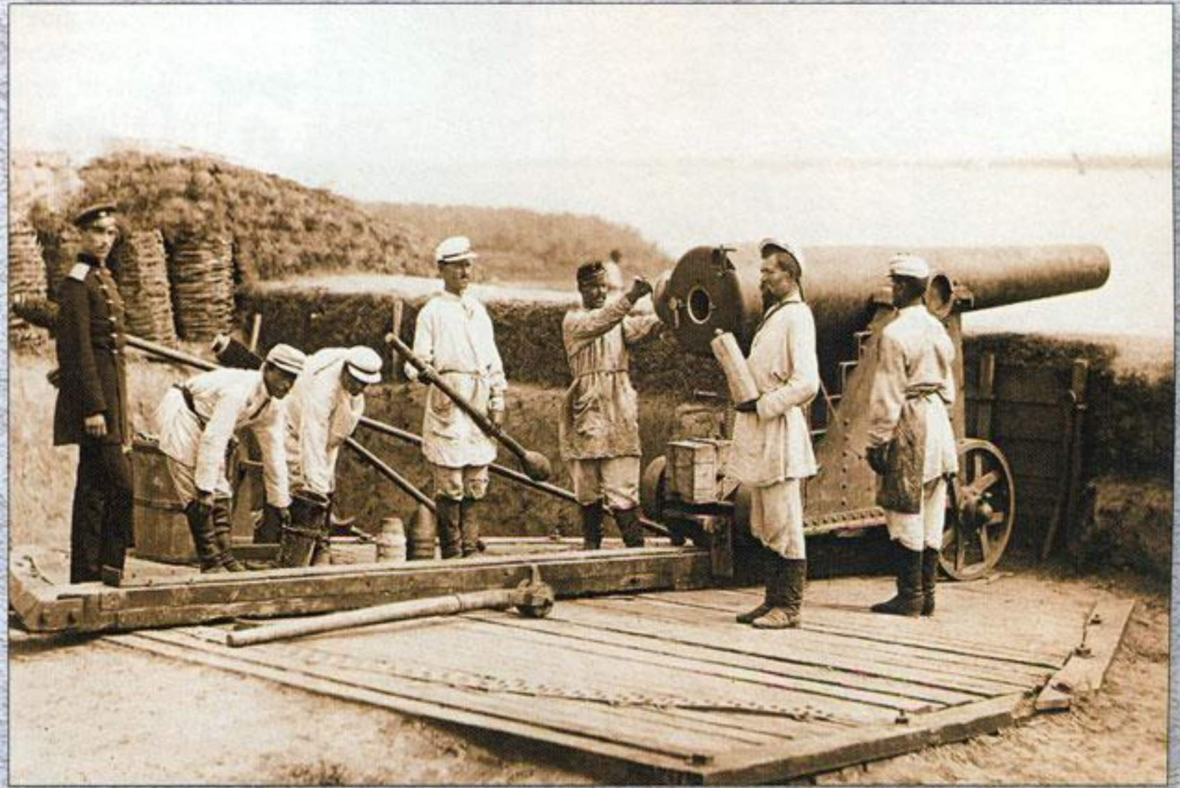
Русская артиллерия на позициях при Корабии (Румыния). Фото 1877–1878 гг.