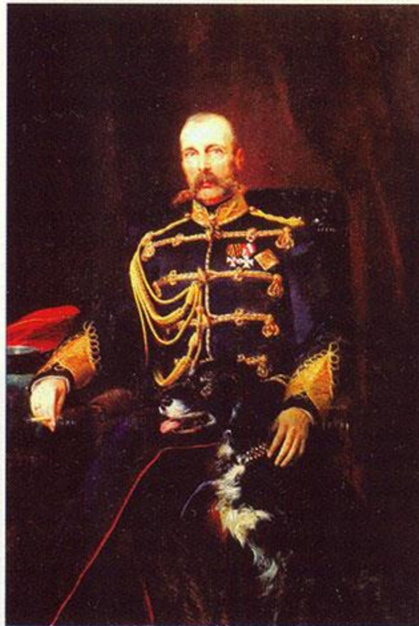
К. Е. Маковский. Портрет Александра II.

Образ Александра II стал формироваться как официальной пропагандой, так и оппозицией ещё при жизни. Ключевым инструментом формирования памяти об императоре до 1917 года служили учебники истории для низших и средних учебных заведений, предлагавшие однозначное толкование: это царь-мученик, ставший жертвой злоумышленников, боровшихся с высшей государственной знатью и покусившихся на самого императора. Так, Д. И. Иловайский в своём переиздававшемся более чем полвека учебнике упоминал «государя кроткого, благодетельствовавшего своими реформами горячо любимую им Россию и пользовавшегося безграничной преданностью своего народа». Иловайский приводил обстоятельную характеристику реформ, отмечая, что «благодаря успехам русской гражданственности и благодушной гуманности императора Александра Николаевича, самое Русское самодержавие, не утратив своей силы и значения, приняло в его время характер абсолютизма мягкого, вполне просвещённого и европейского...» 3 В учебниках либеральной направленности практически не рассматривался эпизод с убийством царя, в то время как консервативными авторами он весьма эмоционально осуждался: «Преобразования и вообще все деяния императора улучшили жизнь русского народа. Несмотря на это, в России появились злонамеренные люди, которые пытались произвести смуту и в этих видах покушались на жизнь государственных сановников и наконец стали посягать на жизнь