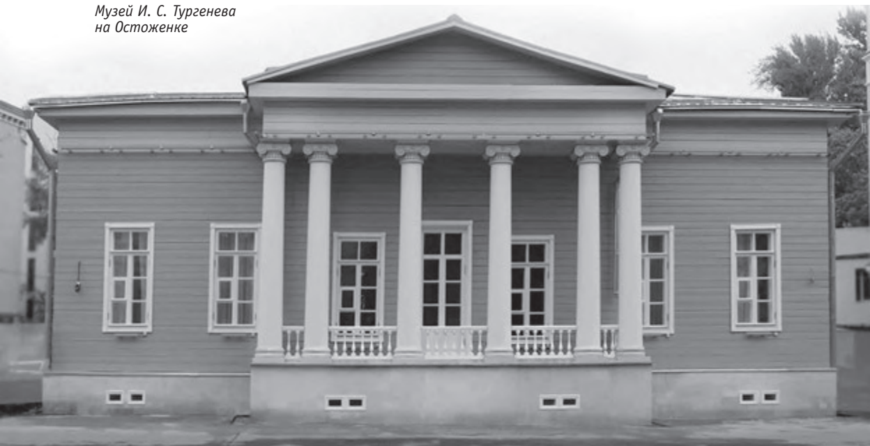
Музей И. С. Тургенева на Остоженке

Лестный отзыв получил Тургенев и от семьи Аксаковых. Впрочем, суждения славянофилов братьев Ивана и Константина Аксаковых были несколько односторонними. О Герасиме Иван Аксаков писал: «Это олицетворение русского народа, его страшной силы и непостижимой кротости... его молчания на все запросы, его нравственных, честных побуждений... Он, разумеется, со временем заговорит, но теперь может казаться и глухим, и немым...». Поэтизируя русский народ, Аксаковы не захотели заметить критики крепостнического строя. Иное впечатление выразил от чтения «Муму» А.И. Герцен: «Он [Тургенев] описал нам существование этого русского "дяди Тома" с таким