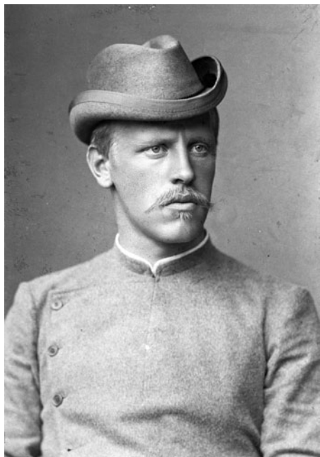
Зарубежные исследователи Арктики Фритъоф Нансен (слева) и Роберт Пири (справа)