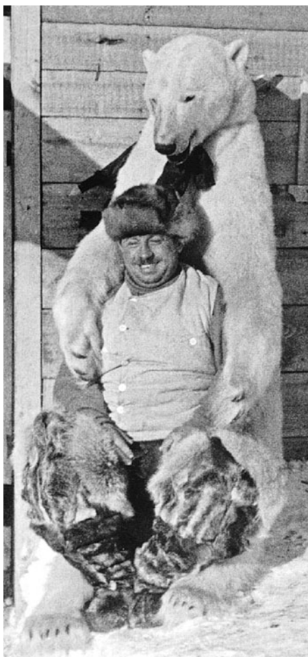
Арктика советская — Иван Дмитриевич Папанин

погодных условий вынуждены были вернуться обратно к Земле Франца-Иосифа. В 1896 году экспедиция завершилась.