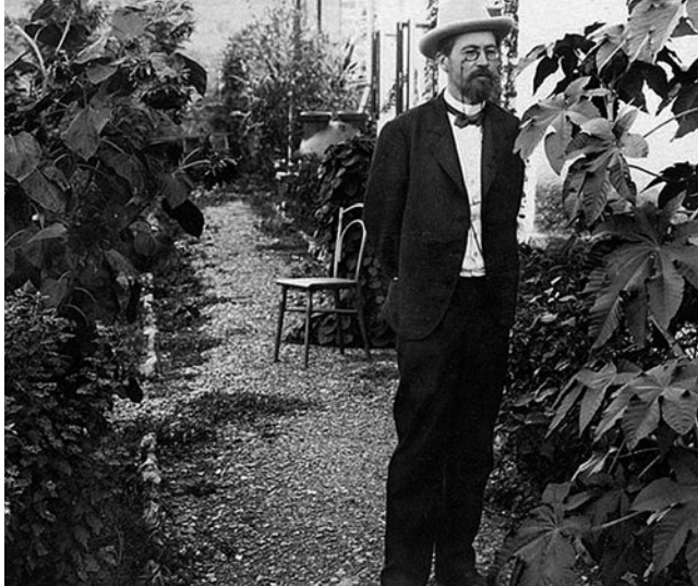
Чехов в Ялте