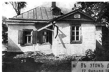
ВЪ ЭТОМЪ ДОМѢ 17 ЯНВАРЯ 1860 Г. РОДИЛСЯ АНТОНЪ ПАВЛОВИЧЪ ЧЕХОВЪ

Город жил не только торговлей, но и огромных размеров контрабандой, существовавшей почти официально. Таганрогский негодник Вальяно (его