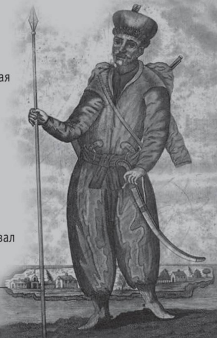
Воин черноморского казачьего войска

235 лет назад, в августе 1787 года, началась очередная русско-турецкая война, продлившаяся до 1791 года. По ее итогам был подписан Ясский мирный договор, закрепивший Крым и Очаков за Российской империей. Граница России с Османской империей была отодвинута до Днепра. Неувядаемой славой покрыли себя русские полководцы князь Григорий Александрович Потемкин и Александр Васильевич Суворов. Отличился в этой войне и Иосиф (Осип) Михайлович де Рибас (1751—1800), или Дерибас, испанский дворянин по происхождению. Он участвовал во взятии укрепленного турками острова Березань, расположенного в десятке километров от Очакова.