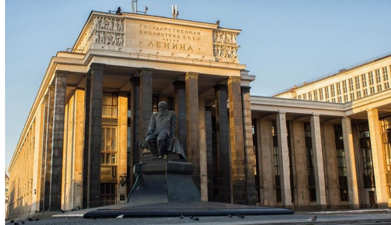
Российская государственная библиотека

Две современные российские библиотеки входят в десятку самых крупных библиотек мира: Российская государственная библиотека в Москве, фонды – 44,8 млн. экземпляров; Российская национальная библиотека в Санкт-Петербурге, фонды - 36,9 млн. экземпляров