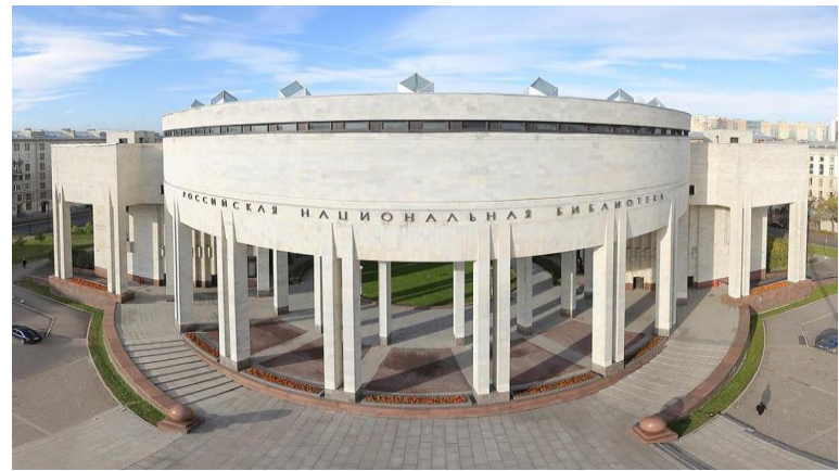
Российская национальная библиотека