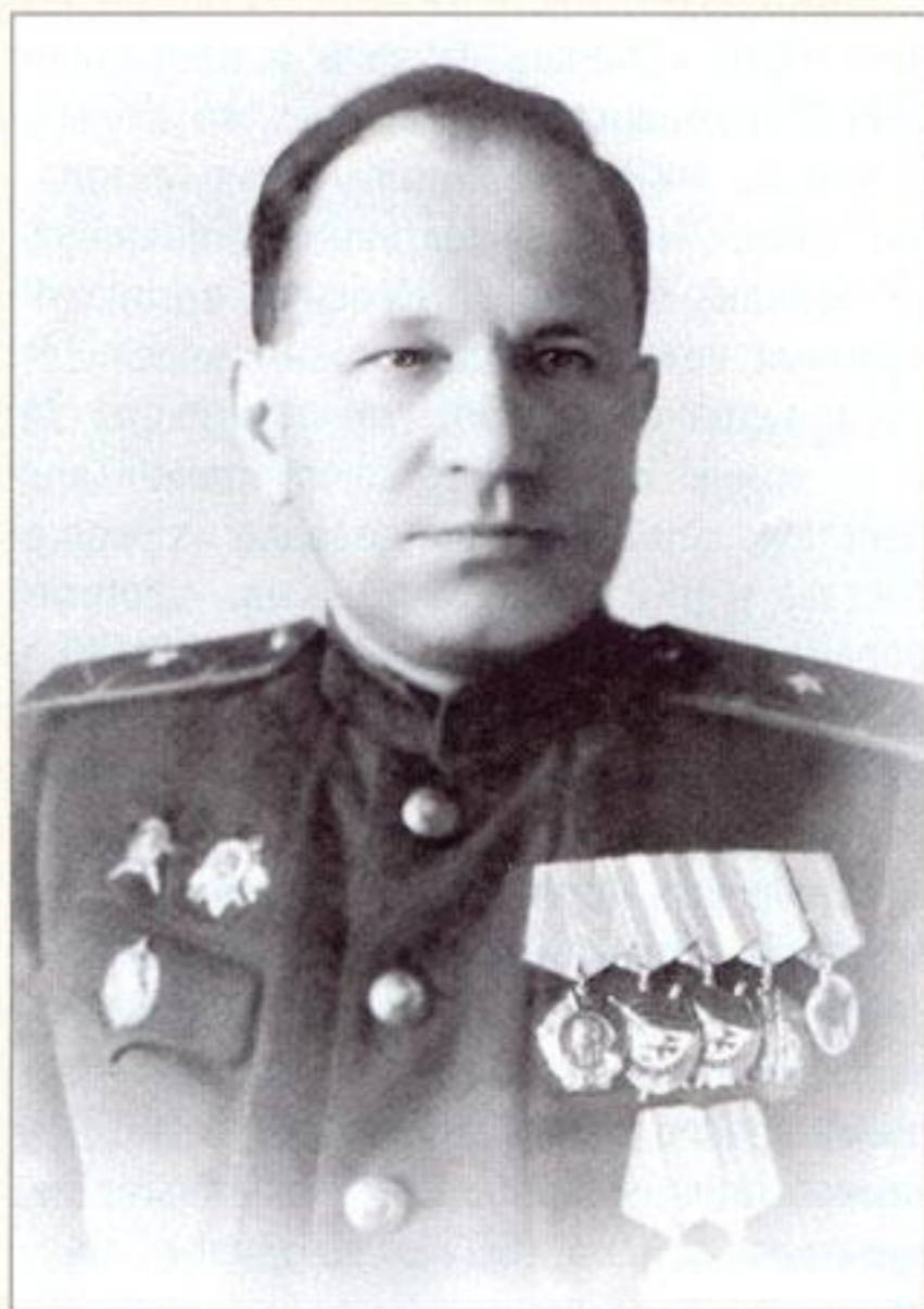
Начальник ОКР «Смерш» НКВД СССР генерал-майор В. И. Смирнов (1944–1946).

ных округов, а также городские (гарнизонные) отделы контрразведки.