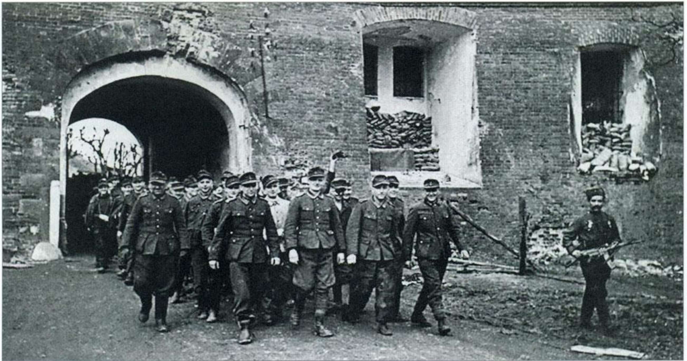
Конвоирование колонны немецких военнопленных.

(15 наименований) 27 . Органами контрразведки «Смерш» вскрывалось и пресекалось хищение грузов. Например, в 1943 году на железной дороге было задержано 15 232 расхитителя грузов, за январь–июнь 1944-го вскрыто 75 случаев групповых хищений и 131 случай мелких одиночных хищений 28 . Летом 1944 года арестовали расхитителей, которые систематически занимались хищением грузов английской миссии 29 . Группу в составе восьми человек возглавлял командир роты 172-го полка НКВД по охране Архангельского порта.