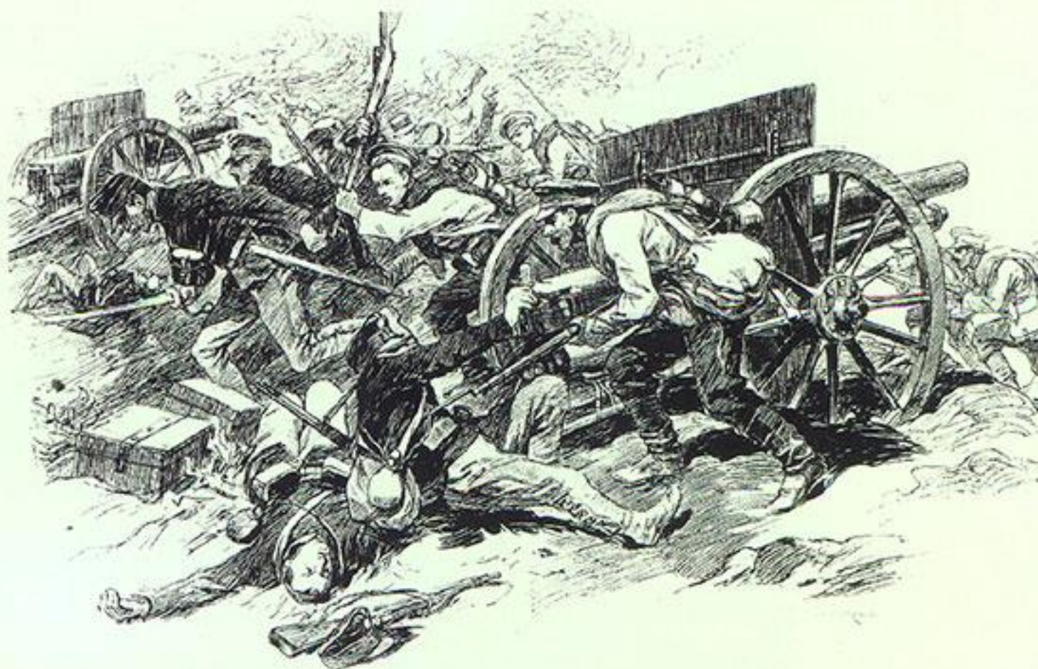
Бой под Ярославом (на Галицийском фронте). Н. С. Самокиш. Иллюстрация из журнала Нива . 8 ноября 1914 года

Оценивать роль каждого участника в коалиционной войне нельзя и по количеству выигранных битв. Они не спасли Германию от поражения, однако даже проигранные Россией сражения внесли свой вклад в общий успех Антанты. Ярчайший пример — провальная Восточно-Прусская операция Северо-Западного фронта 1914 года, которую русские начали ещё до завершения мобилизации. Полного разгрома французских войск удалось избежать дорогой ценою, но уже месяц спустя Россия выручила британцев и бельгийцев, сражавшихся на Изере и Ипре. Для этого она перенесла военные действия на левый берег Вислы, отказавшись от первоначального плана действий против австрийцев. Францию Россия спасала ещё не раз — Нарочской операцией (1916) и Июньским наступлением 1917 года. Дважды, Галицийской битвой (1914) и Карпатской операцией (1915), она спасала Сербию. По просьбе Италии раньше срока было начато наступление Юго-Западного фронта в 1916 году. Тогда же был создан целый фронт, чтобы поддержать Румынию.