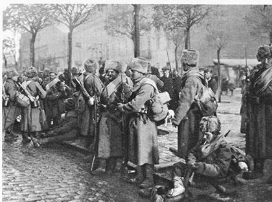
Сибирские пехотинцы в Варшаве. 1914 год

Переброска войск, к которой постоянно приходилось прибегать Четверному союзу, снижала их боеспособность и заставляла терять время. Противник пять раз вынужден был проводить крупнейшие передислокации своих дивизий на Восток. В августе–сентябре 1914 года германские войска из Франции и австрийские с Балкан снимались в Восточную Пруссию, той же осенью – в Силезию и Венгрию. Весной–осенью 1915 года ряд элитных ударных соединений и резервов были брошены на Восточный фронт в надежде выве-