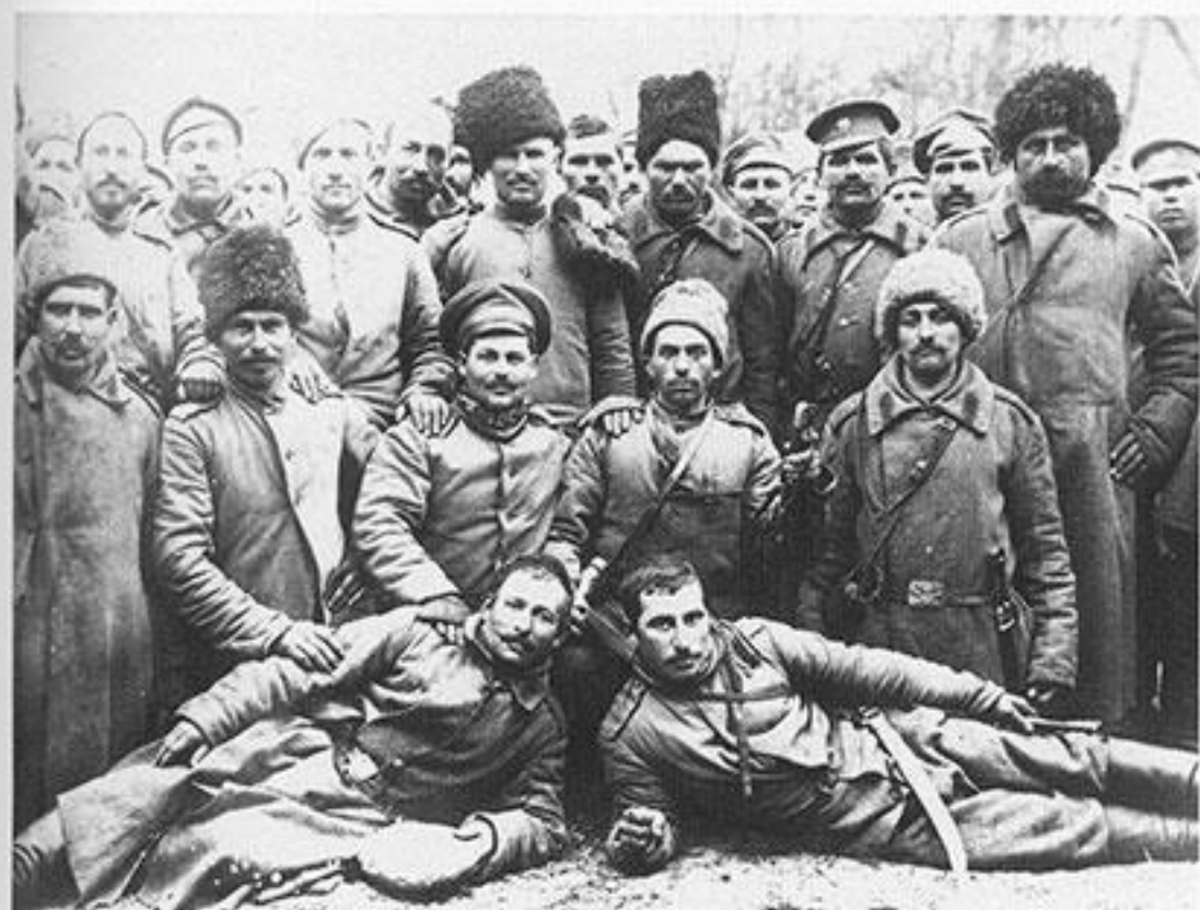
Артиллеристы на Кавказе

При этом Русский фронт оттягивал на себя основные силы противника. Здесь сосредотачивалось от 78 (декабрь 1914 года) до 49% (ноябрь 1917 года) австро-венгерских дивизий, от 18 (август 1914 года) до 41% (август 1915 года) германских, от 29 (август 1915 года) до 72% (август 1916 года) турецких и от 17 до 33% болгарских. В среднем, против России воевали около половины (42%) всех сил Четверного союза, включая почти всю конницу (23 кавалерийские дивизии к концу 1916 года).