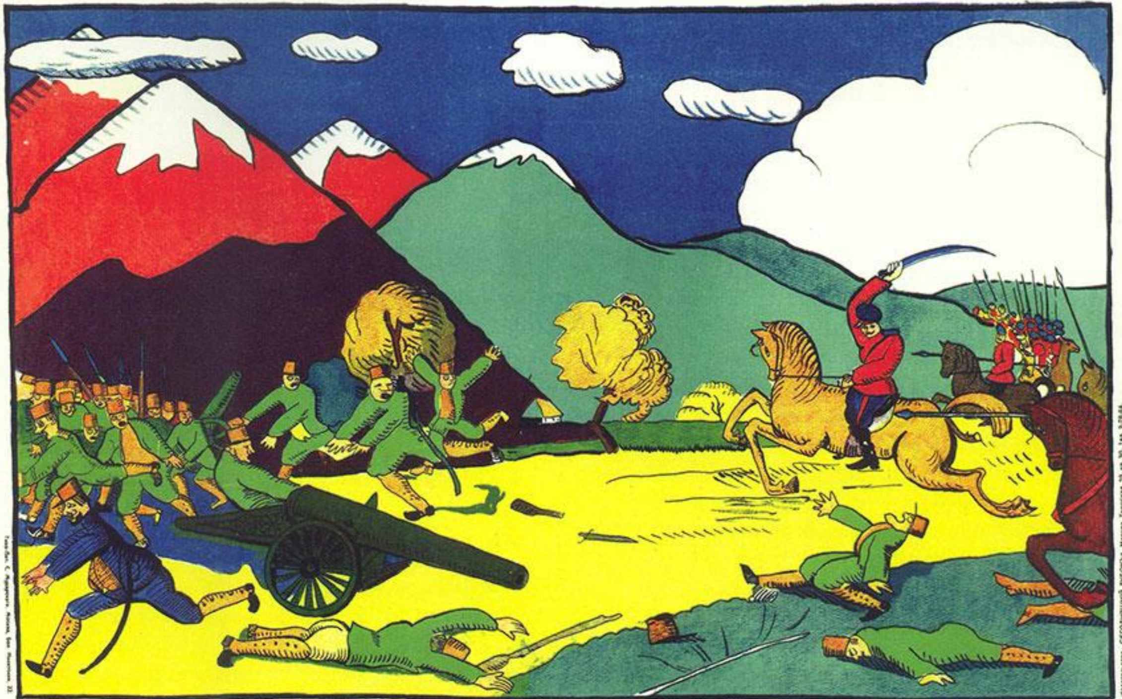
Австріяни у Карпатъ, Поднимали благой матъ.