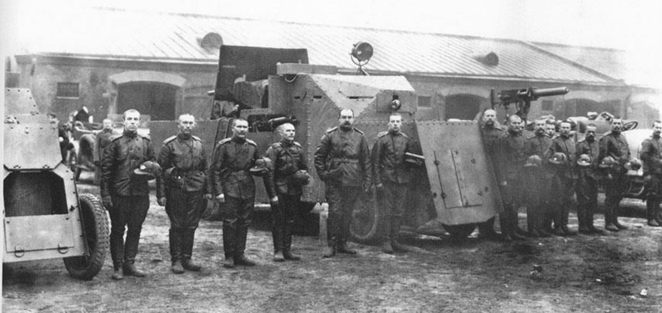
Напутственный молебен 1-й автопулемётной роты в Петрограде. 19 октября 1914 года

Решающее значение Восточного фронта отразилось и в боевых потерях германского блока.