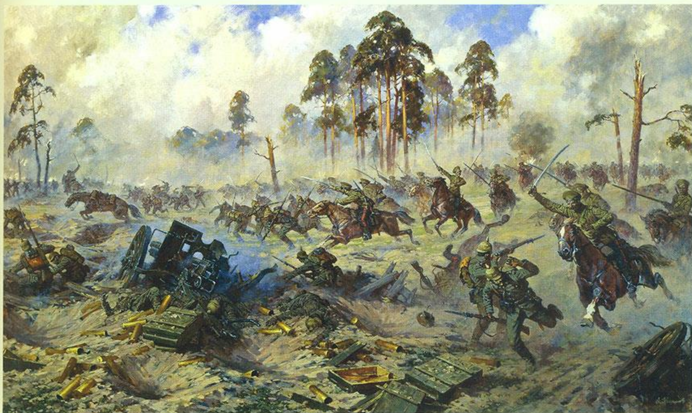
Атака казаков. 1914 год. А. Ю. Аверьянов. 1995 год

России приходилось постоянно «разрываться» между выполнением союзнического долга на Северном и Западном фронтах и реализацией собственных стратегических замыслов на «ударных» Юго-Западном и Кавказском. Похоже, она следовала старинному русскому воинскому принципу: «Сам погибай, а товарища выручай». Прослеживается некая закономерность: Россия проигрывала вынужденные операции, но неизменно добивалась успехов на важных для себя направлениях. Это Галицийская битва, Карпатская операция, Брусиловский прорыв, Эрзерумская,