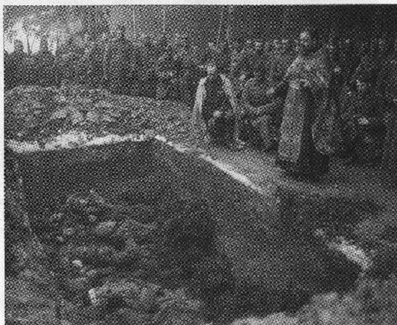
Главнокомандующий армиями Юго-Западного фронта А. А. Брусилов принимает рапорт командира бронедивизиона. Август 1916 г. Фотограф неизвестен. РГАКФД. Ал. 129, сн. 96.