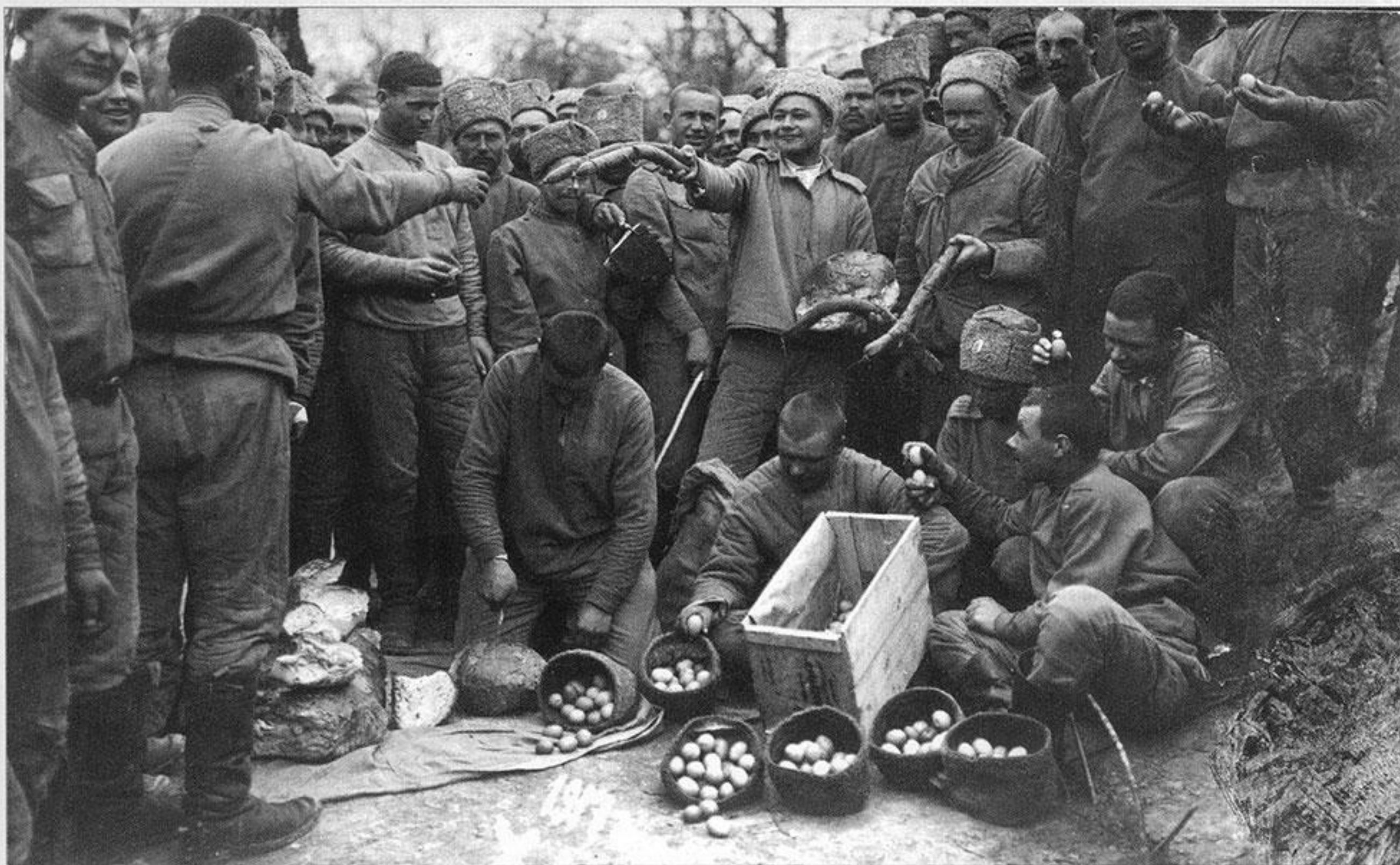
Раздача куличей и яиц в 9-й роте 9-го гренадерского Сибирского полка во время пасхальных торжеств. Волынская губерния. 3 апреля 1917 г. Ал. 616, сн. 37.

Первая мировая не просто привлекла внимание к фотографии и фотодокументалистике. Она сделала визуальную фотоинформацию самым массовым и востребованным из искусств, выведя её из разряда дорогих увлечений и «превратив в мощное пропагандистское средство воздействия на общество и его членов» 12 .