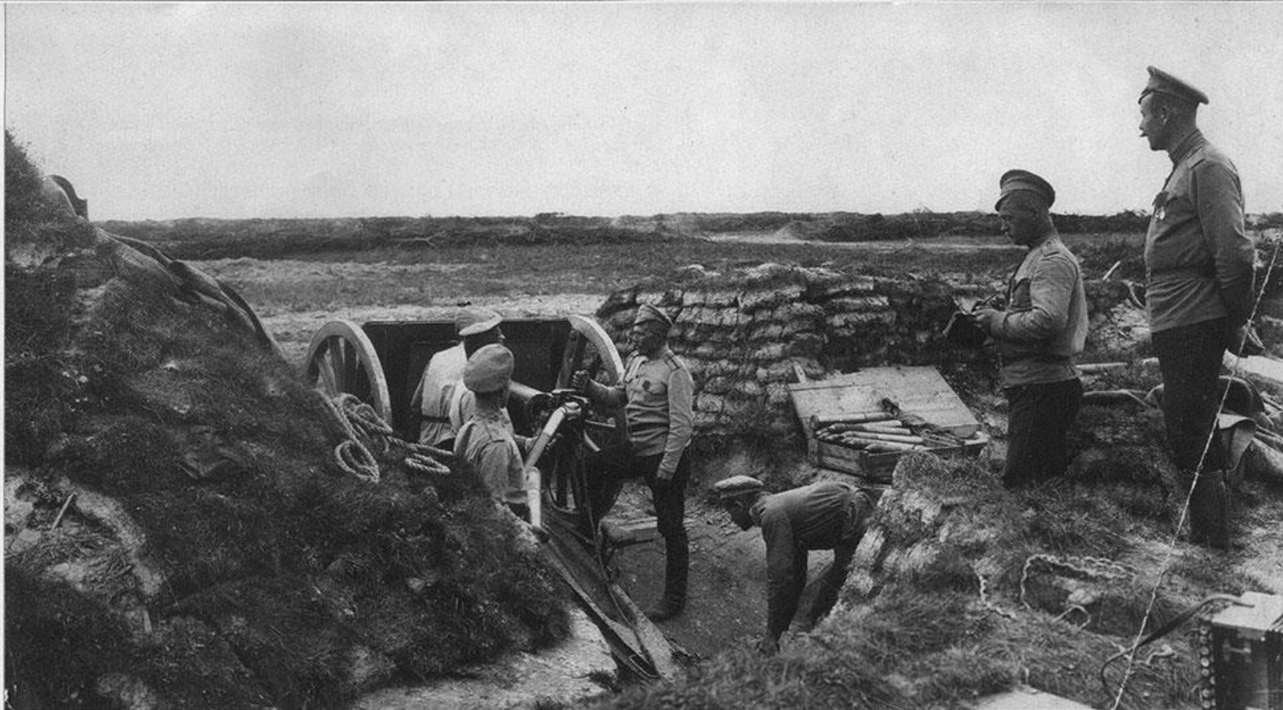
Заряжание орудия 4-й батареи 2-й гренадерской артиллерийской бригады. Юго-Западный фронт. 1917 г. Ал. 1294, сн. 56.

И здесь мы подходим к главному, капитальному отличию русской фотографии Первой мировой от западной. Если на Западе потребности общественности в получении информации, сложившаяся школа новостного репортажа, а также известная привычка политиков и военных прислушиваться к общественным запросам привели к организации на фронте профессиональных фотосъемок, то в России жёсткая цензура, давняя традиция не перечить начальству и весьма ограниченный контингент фронтовых фотографов-профессионалов обусловили массовую практику постановочных, почти студийных фоторассказов о быте солдат и офицеров. Конечно, через массу постановочных и бытовых фотографий порой пробивались кадры поистине драматической силы, но они были лишь исключением, подтверждающим правило.