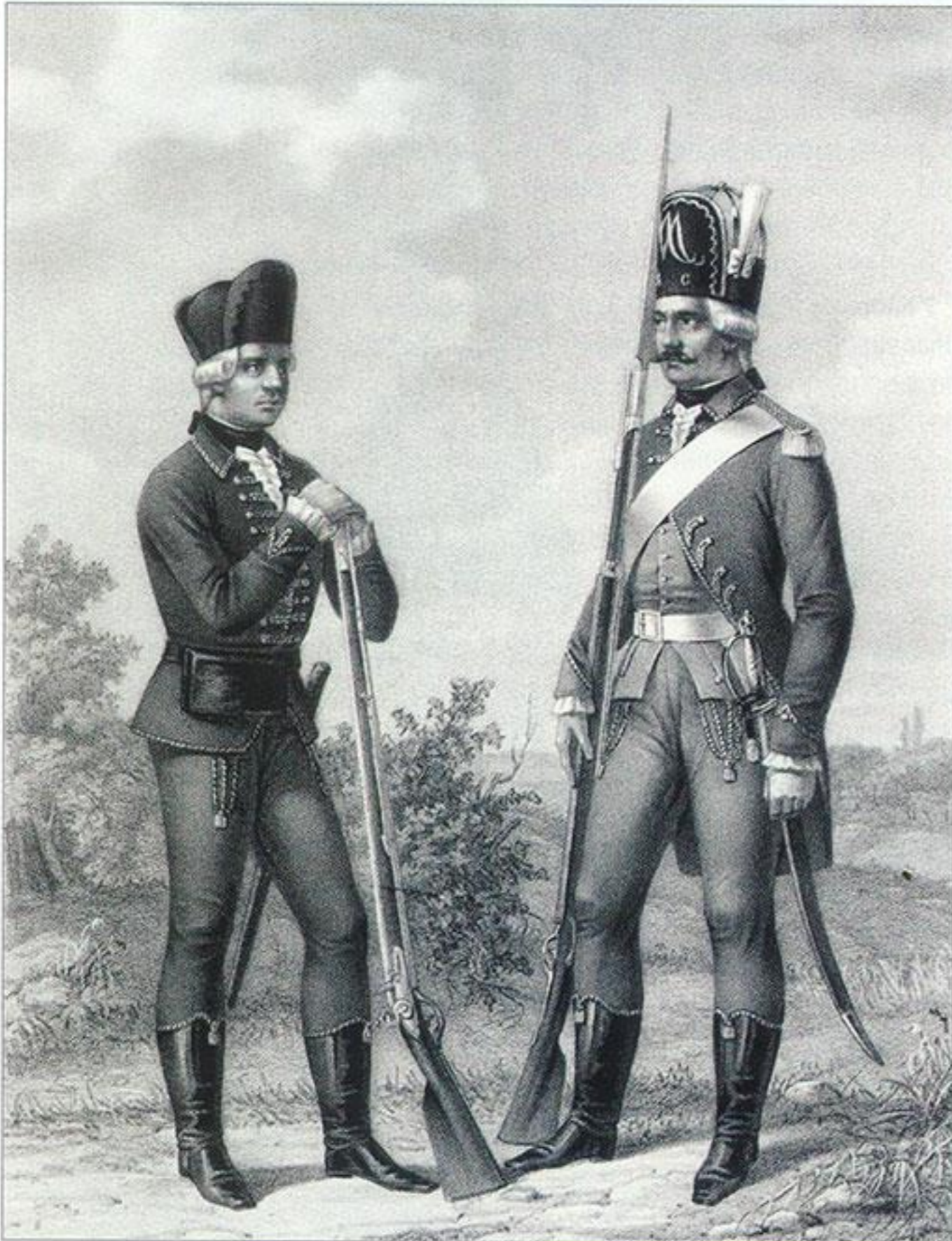
Егерь и мушкетёр Московского легиона с 1769 по 1775 г.