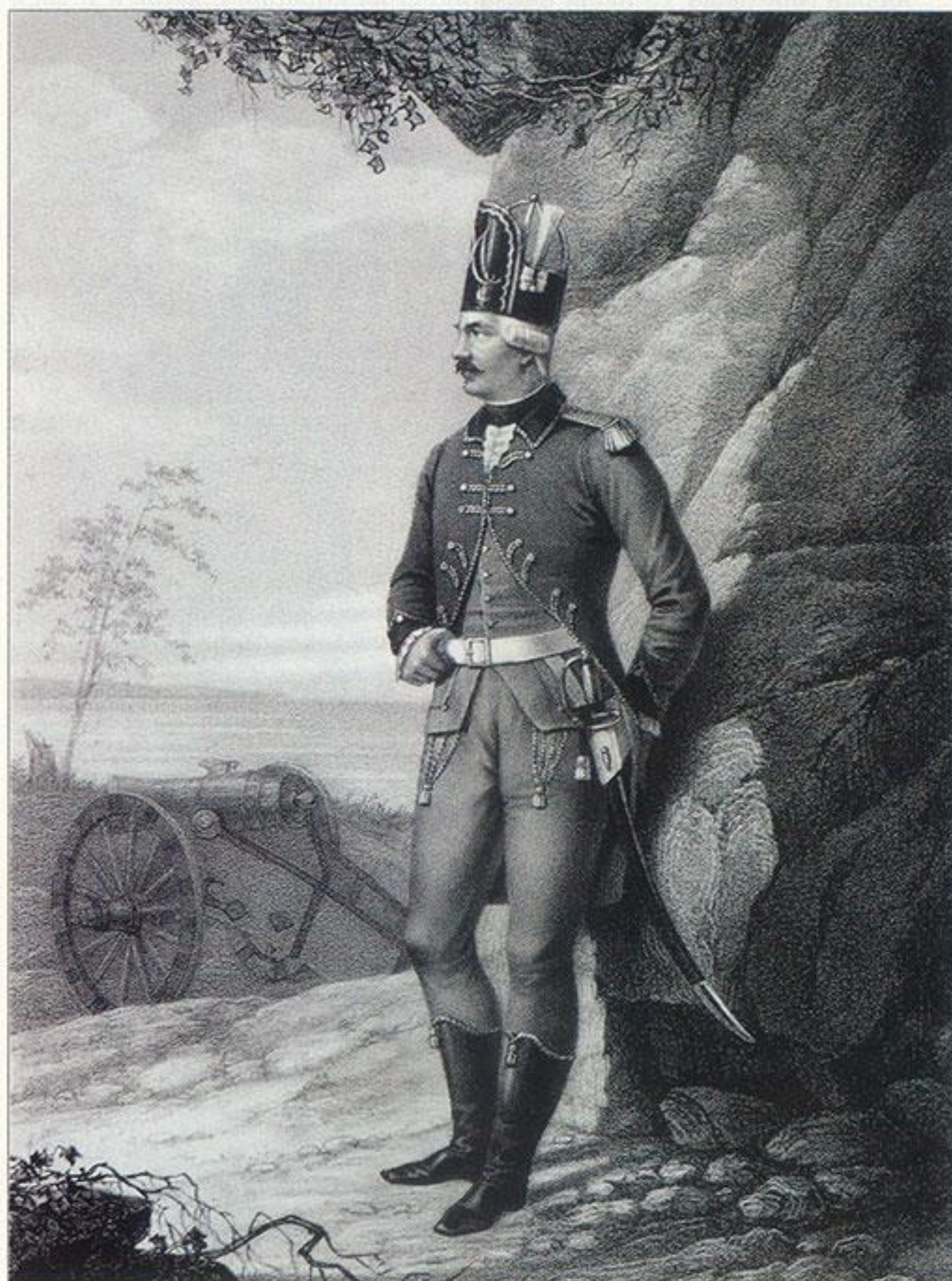
Рядовой артиллерист Московского легиона с 1769 по 1775 г.

Крым в 1774 году занимали части 2-й русской армии под командованием генерал-аншефа князя Василия Михайловича Долгорукова. Штаб командующего располагался на Днепре, а непосред-