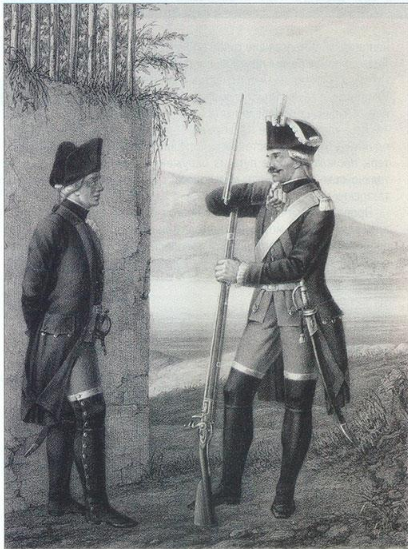
Мушкетёры: нестроевой и рядовой лёгких полевых команд с 1771 по 1775 г.

Сдерживать напор становилось всё труднее. Татары подтащили копны сена и соломы и подожгли их, чтобы дымом выкурить защитников. Поднявшийся ветер заволок позиции русского отряда удушливой пеленой и ещё сильнее раздувал огонь. Вскоре пламя добралось и до самих укреплений. Бревенчатый палисад, туры, фашины, деревянные постройки, высушенные южным солнцем, полыхнули как порох. Пожар стремительно расширялся, оставаться в дыму и пламени было уже невозможно. Русские солдаты были вынуждены оставить свои позиции и начать отходить. Только идти было некуда — кругом враги. Заняв оборону на последнем рубеже, за церковной оградой, брянцы продолжали сражаться, но турки наседали со всех сторон. Надежды на спасение не оставалось, повсюду были торжествующие