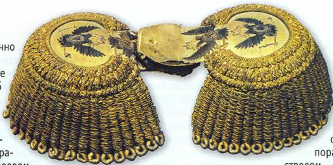
Вице-адмиральские эполеты П. С. Нахимова.

Нахимов назначил сражение на 18 ноября и отдал приказ об атаке неприятельского флота, находящегося на Синопском рейде. Флотоводец был уверен в победе. Он составил диспозицию, в которой каждому кораблю было указано его место в боевом порядке. Судам надлежало войти в бухту, встать на якорь и огнем корабельной артиллерии уничтожить неприятельские корабли и береговые батареи. «Я предоставляю каждому совершенно независимо действовать по усмотрению своему, но непременно исполнить свой долг». В приказе говорилось: «Не палить даром по тем из судов, кои спустят флаги... Стараясь лучше употребить время для поражения противящихся судов или батарей, которые, без сомнения, не перестанут палить, если с неприятельскими судами дело и было бы кончено». Вице-адмирал специально разъяснил своим подчинённым: «Первые выстрелы должны быть прицельные с особенным вниманием». В те времена использовали дымный порох. Клубы плотного дыма мешали рассмотреть неприятеля и вести