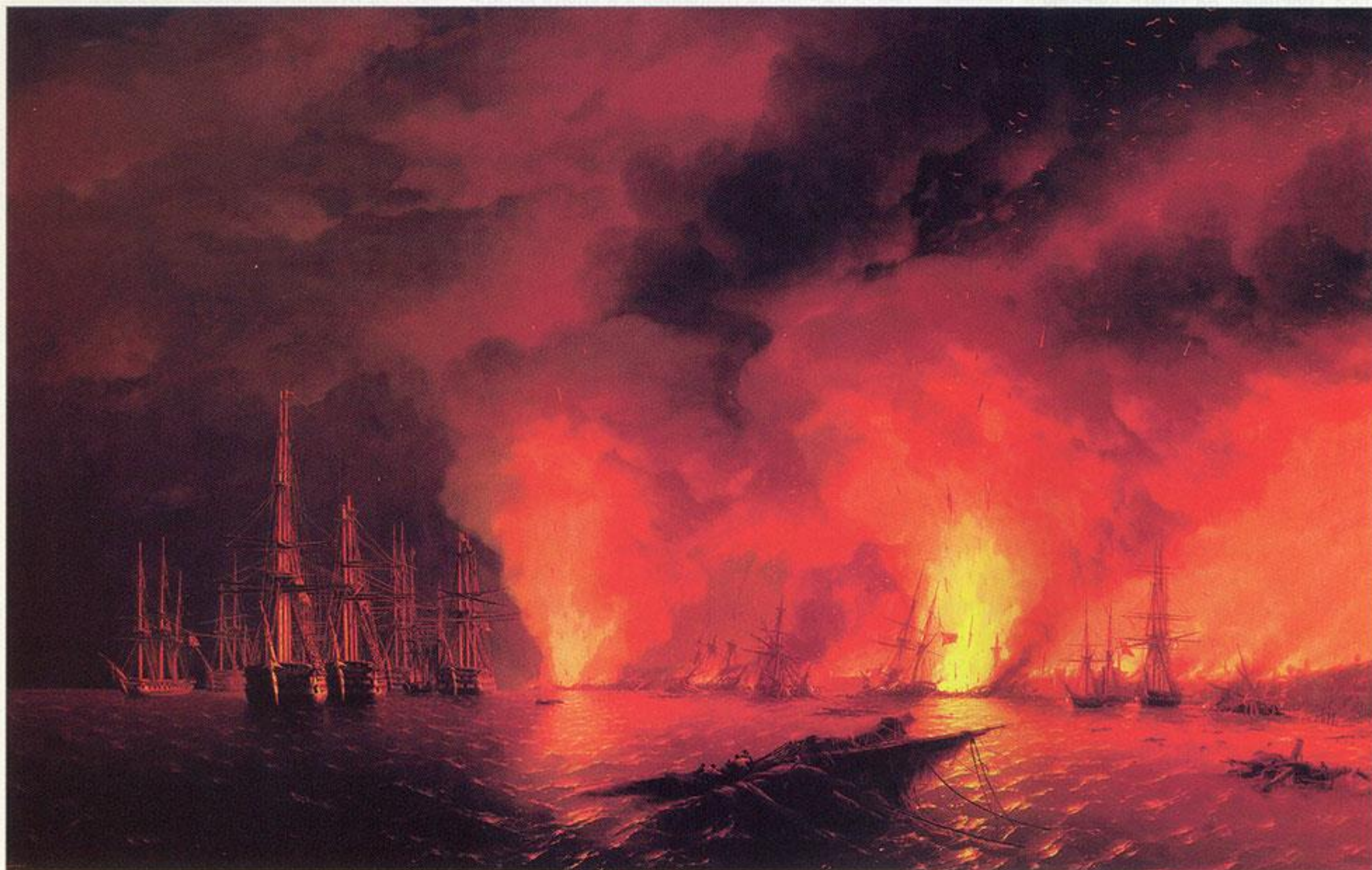
И. К. Айвазовский. Синопский бой.

ком Морского корпуса надлежало совершить не менее 5 учебных плаваний. Воспитанники младших классов (рот) Морского кадетского корпуса именовались кадетами, а воспитанники старших классов — гардемаринами. Во время учебных плаваний кадеты и гардемарины Морского корпуса, наравне с простыми матросами, ставили и убирали паруса, а также выполняли всю