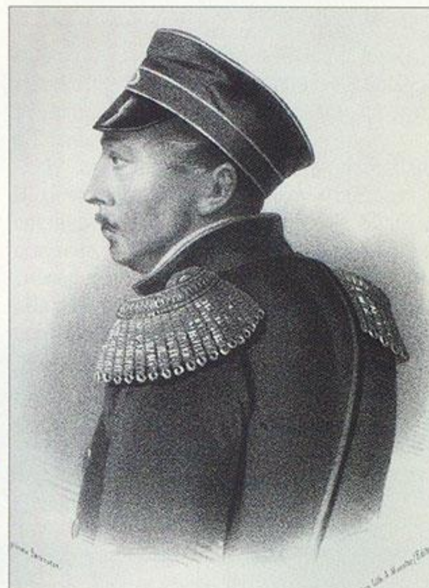
Адмирал П. С. Нахимов. Литография.

Будущих офицеров российского флота с молодых лет основательно знакомили с тяготами и лишениями нелёгкой морской службы и азами морской науки. Для того, чтобы стать офицером флота, воспитанни-