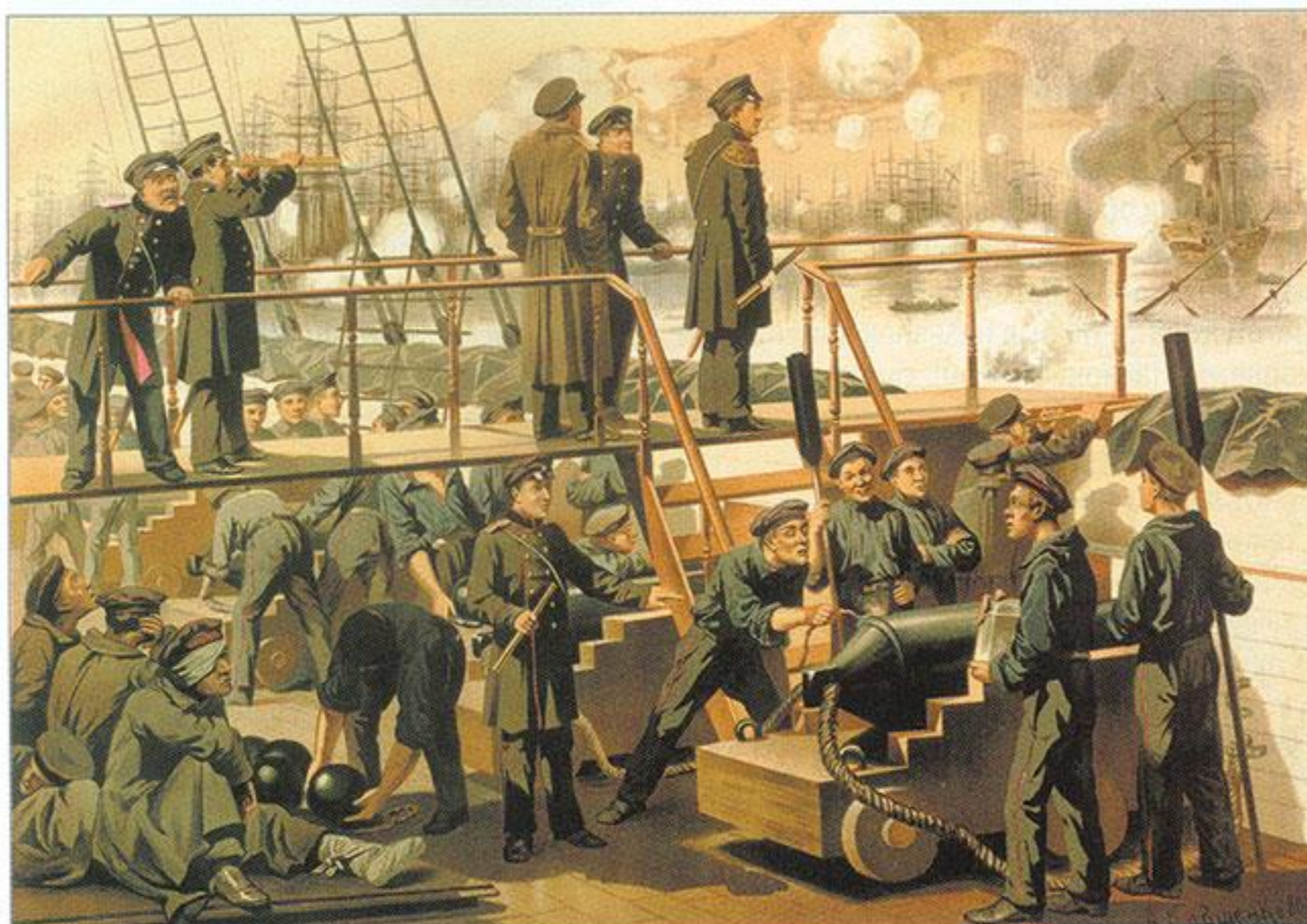
А. Д. Кившенко. Синопская битва. Истребление турецкого флота. 1853 г.

а его командир, по словам главного командира Черноморского флота вице-адмирала Лазарева — «образцом для всех командиров кораблей» 10 . Офицеры Морского корпуса неустанно повторяли своим воспитанникам: «Если вы, поступив в корпус, не мечтаете о том, чтобы со временем стать командиром линейного корабля, то вы неправильно выбрали свою дорогу в жизни».