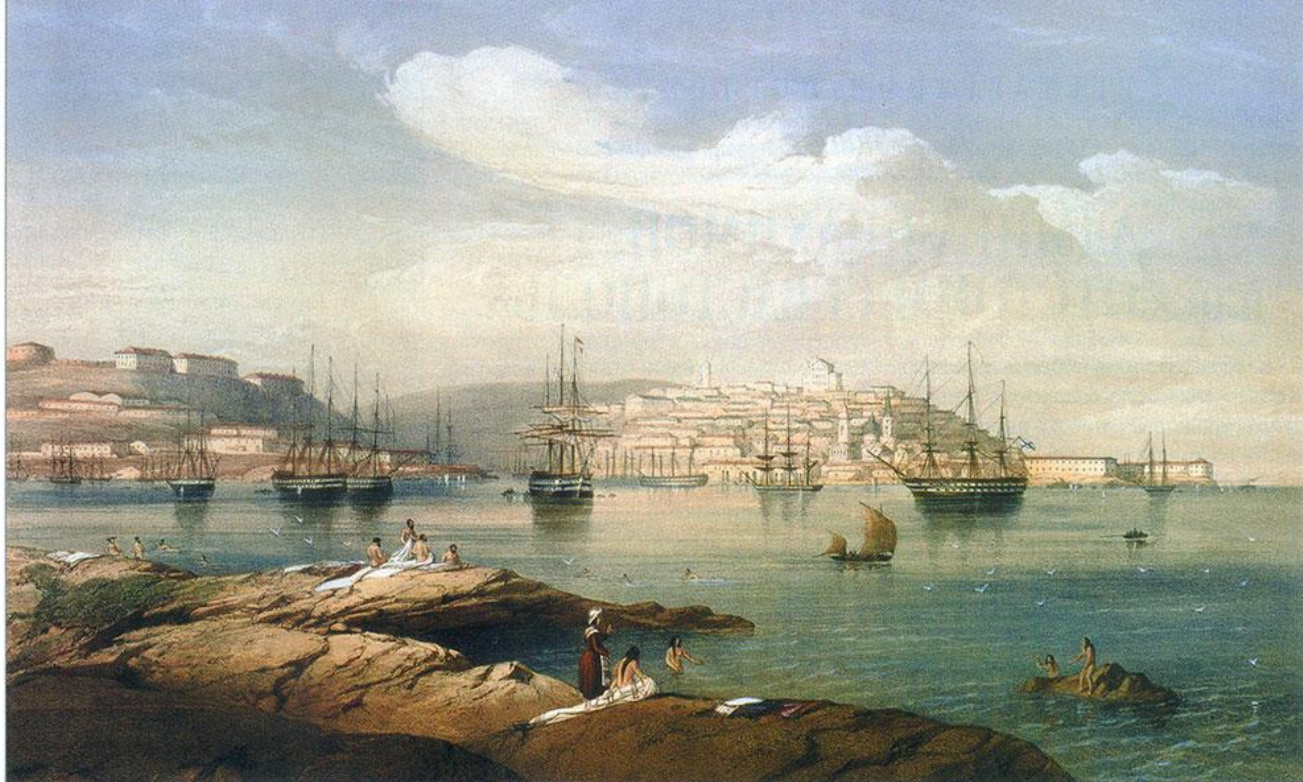
Вид Севастополя от Северного укрепления.

тяжелую работу на корабле. Они сами убирали за собой свои койки, и каждый из них имел под погоном иголку с ниткой и умел пришить пуговицу или поставить заплату.