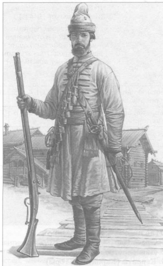
Полки «нового строя».

Стрелец — служилый человек «по прибору» в XVI — начале XVIII в.; пехотинец, вооруженный «огненным боем». Стрельцы составили первое постоянное пешее войско