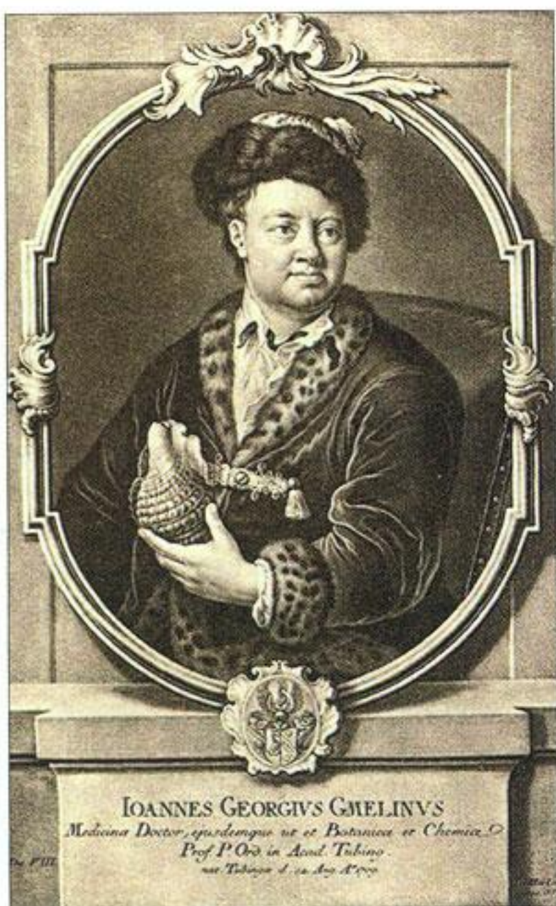
Портрет И.Г. Гмелина.

Титул первого издания книги И. Гмелина «Путешествие по Сибири, содержащее описание нравов и обычаев народов этой Земли, течения главных рек, расположение горных цепей, больших лесов, рудников со всеми историческими фактами, которые определяют особенности этого края». Том I. 1751.