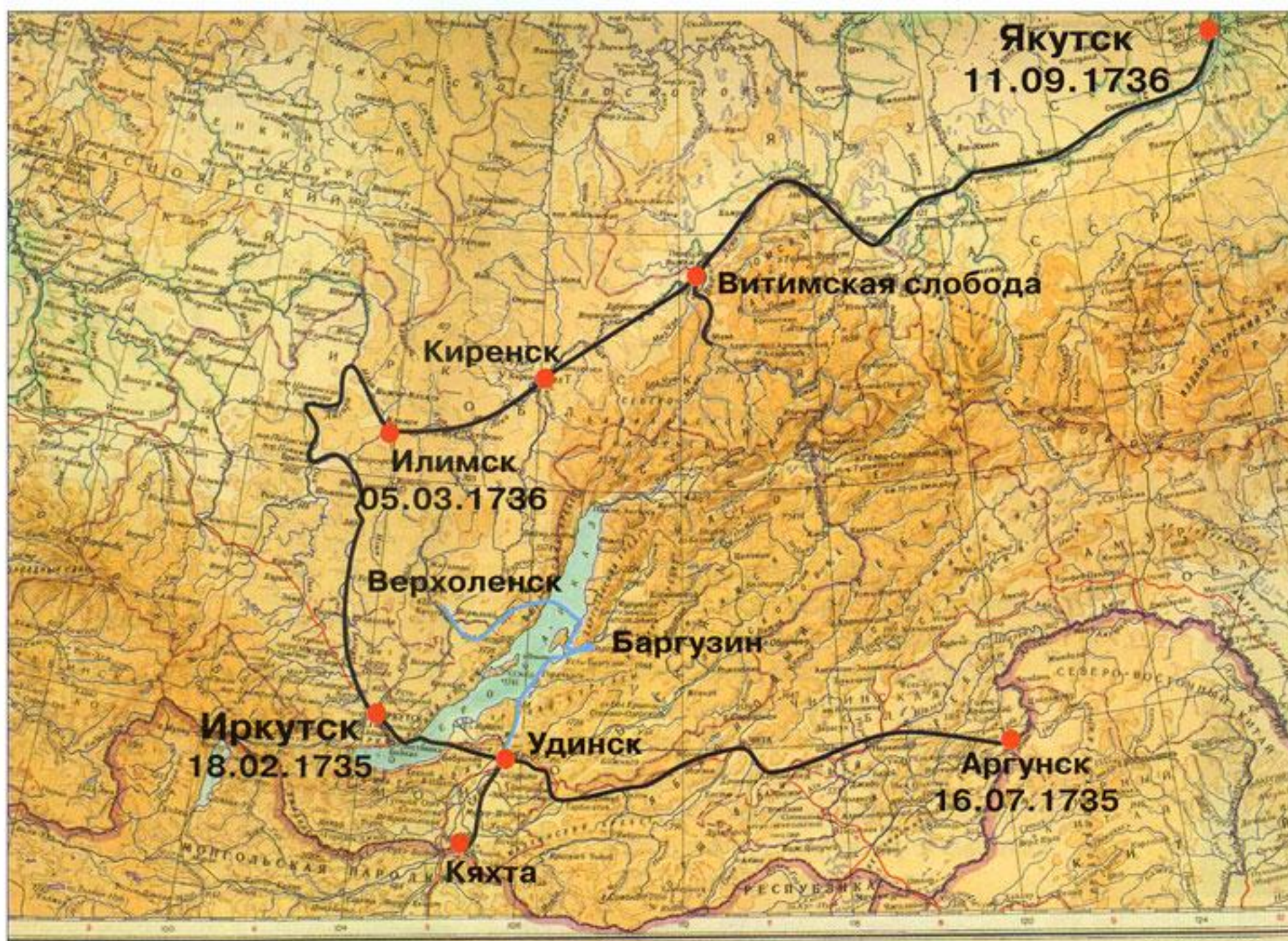
Схема маршрутов путешествия отряда И. Гмелина по Восточной Сибири в 1735–1737 гг. (голубым цветом — без его личного участия).

Прибайкалье, собранные Гмелиным. Он привел отрывки переводов оригинала, но без комментариев, поскольку в те годы методических разработок по истолкованию и тем более параметризации первичных сведений о таких природных катаклизмах не существовало не только в России, но и в Европе. Манассеин справедливо полагал, что именно Гмелин впервые осветил сейсмические события в Сибири до сороковых годов XVIII в.