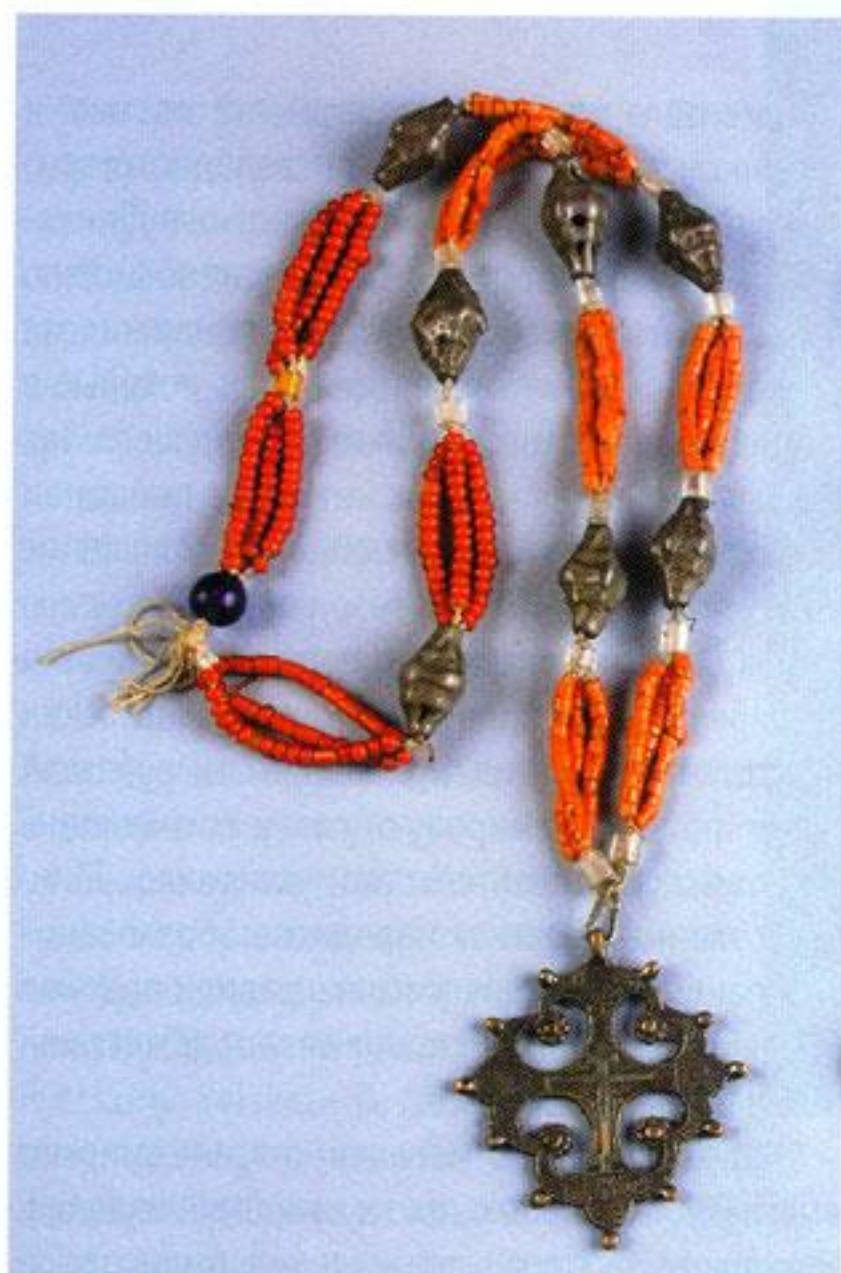
Почепня, крали «добрые». XIX в. Смоленская губ., Бельский уезд. Серебро, олово, кораллы, стекло.

Псков, Череповец, Кирилло-Белозёрский и Ферапонтов монастыри. Видимо, в этих поездках у княгини родилась идея создать универсальный музей, отражающий все стороны быта народов, входивших в Российскую империю.