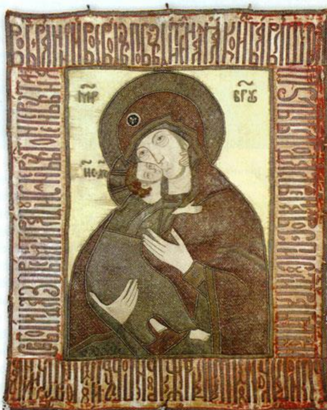
Пелена «Богоматерь Владимирская». XVI в. Россия. Атлас, холст, шёлковые, серебряные, золотные нити, жемчуг. Вокруг изображения литургическая надпись.

принято решение о ликвидации её залов. К моменту закрытия экспозиции собрание составляло уже 580 произведений.