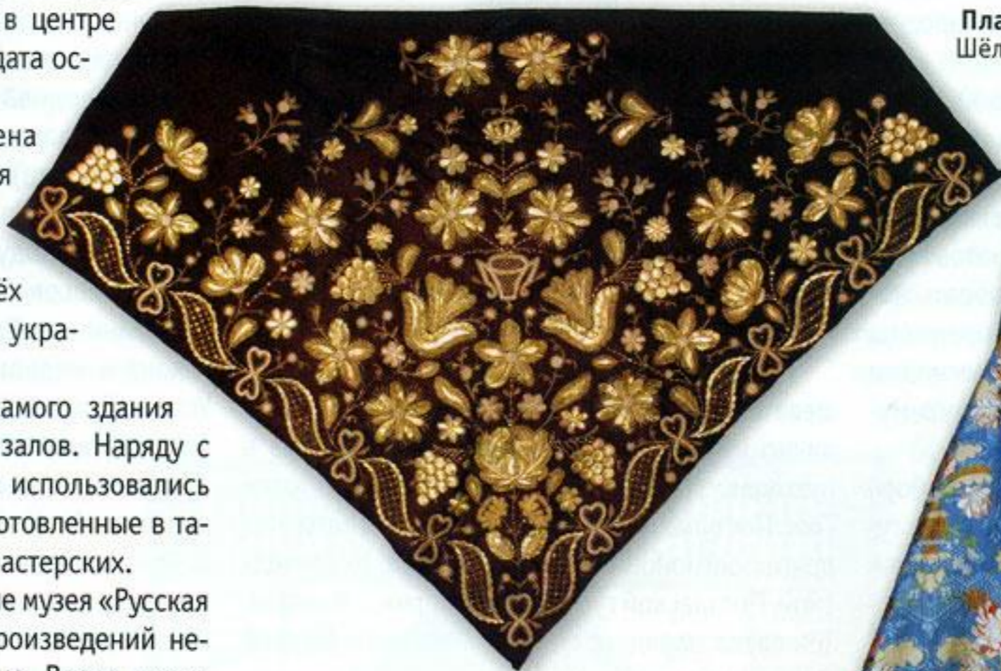
Платок. XIX в. Нижегородская губ. Шёлк, золотные и серебряные нити, бить, блёстки, шитьё.

Через несколько месяцев княгиня открыла выставку талашкинских кустарных изделий. Буквально за месяц все изделия были раскуплены. В своих дневниках Мария Клавдиевна отметила, что обе её выставки сильно отразились на модах и принадлежностях женского туалета, на ювелирном деле, что очень порадовало её и было наградой за понесенные труды. По этому поводу в письме Рериху она заметила: