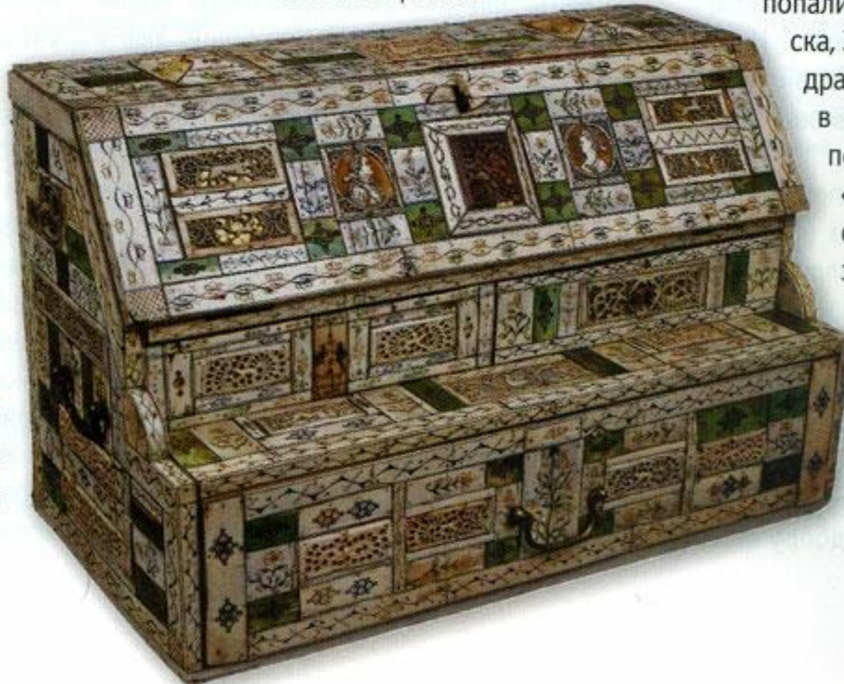
Ларец-туалет. Вторая половина XVIII в. Архангельская губ., с. Холмогоры. Кость, резьба ажурная, рельефная, цветная гравировка, оклейная работа.

31 августа 1912 года, во время празднования 100-летия победы в От- чественной войне 1812 года, музей посетил Николай II со своей семьёй. После осмотра он выразил согласие на наименование института «имени императора Николая II». Музей отны- не стал именоваться «Историко-этно- графический музей Императорского Московского Археологического инсти- тута имени императора Николая II, со- бранный княгиней М. К. Тенишевой в г. Смоленске».