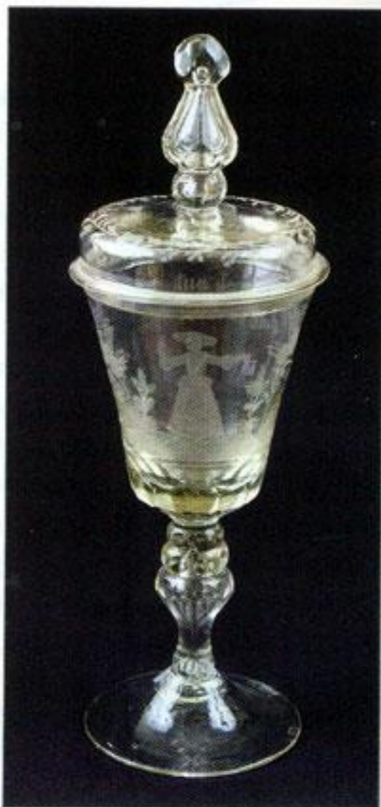
Бокал с крышкой. Начало XVIII в. Россия. Бесцветное стекло, гранение, матовая гравировка. На стенке надпись: «Душа вошь мне соделаю тебе».