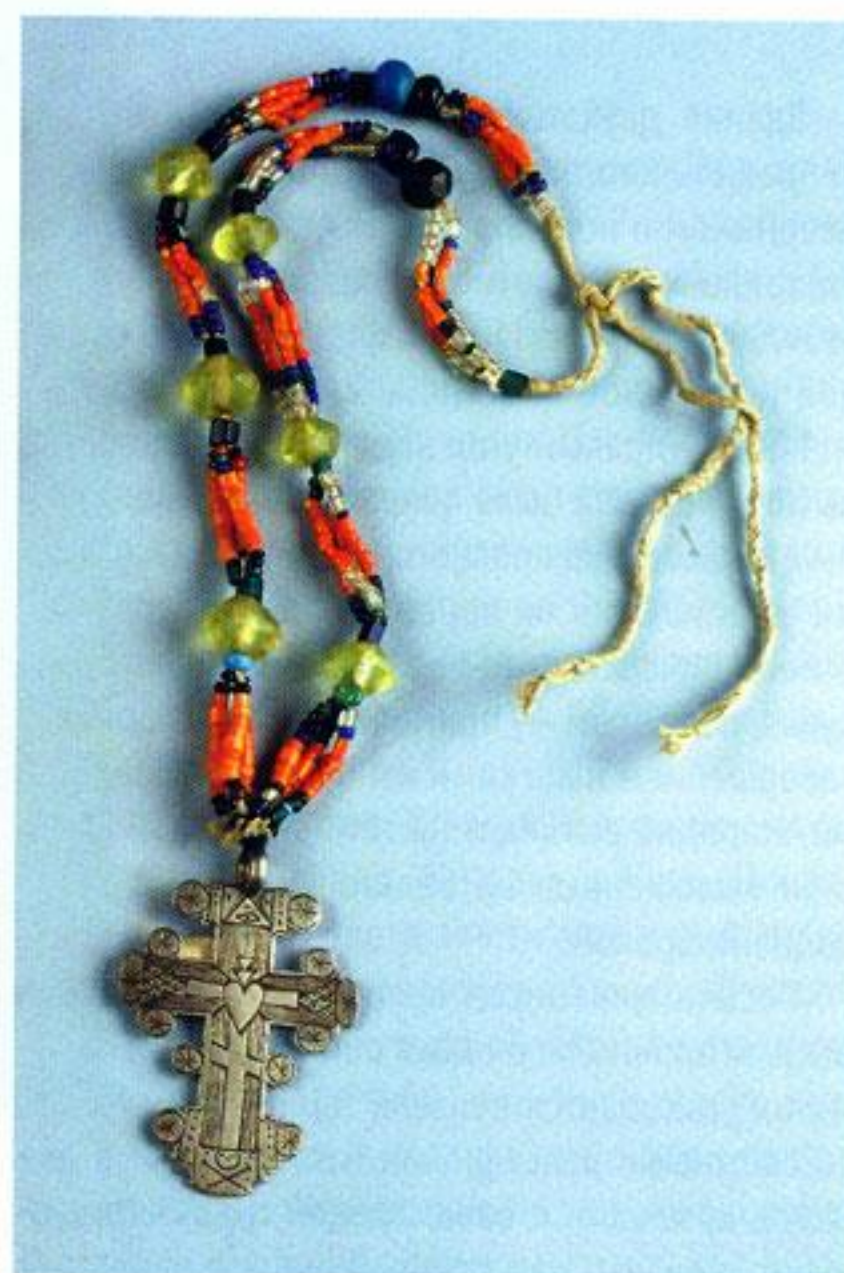
Крали «добрые». XIX в. Смоленский уезд, д. Верхние Немыкари. Серебро, кораллы, стекло.