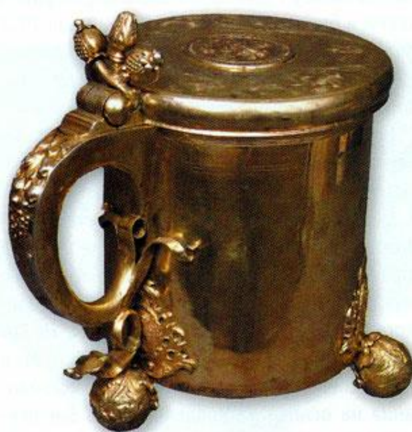
Кружка. Вторая половина XVII в. Рига. Мастер Генрих Майер. Серебро, литъё, золочение.

и журналов библиотека музея «Русская старина».