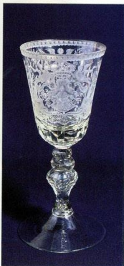
Бокал. Середина XVIII в. Россия. Бесцветное стекло, гранение, матовая гравировка.