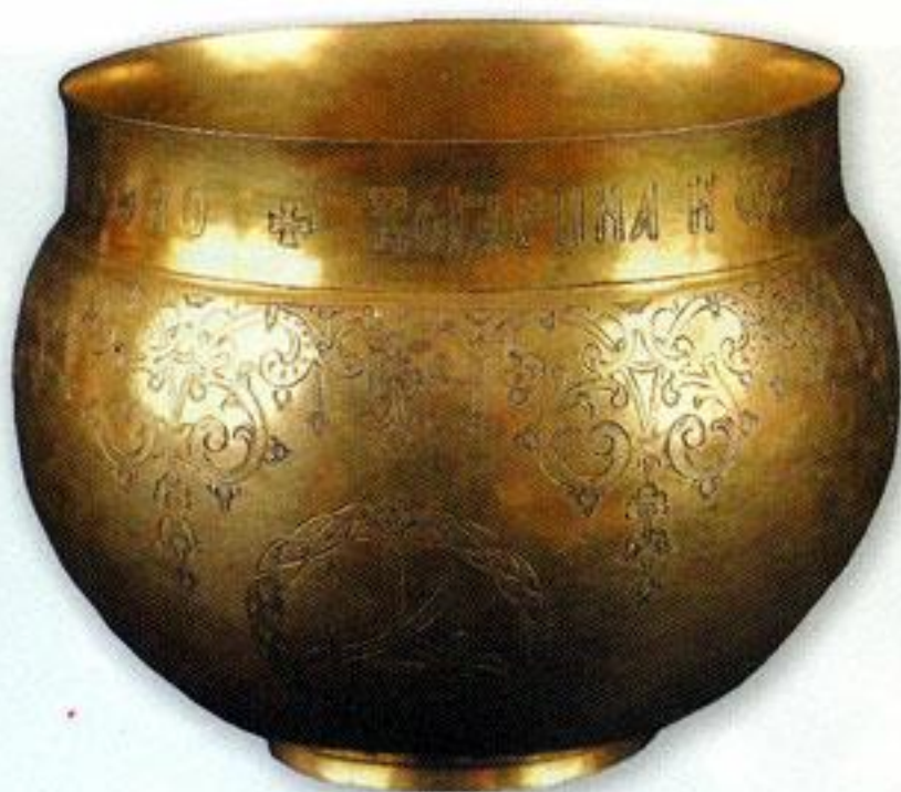
Братина. XVII в. Швеция (?). Серебро, гравировка, золочение. По венцу резная надпись: «Боярина и оружейничего Богдана Матфеевича Хитрова».

Всего было спасено 26 052 экспоната. Из собрания Тенишевой эвакуировали в основном изделия из драгоценных металлов: кубки, чарки, кружки, наградные ковши, серьги, пуговицы, оружие, книги и иконы в драгоценных окладах, лицевое шитьё, ряд живописных полотен. Всё остальное осталось на месте. На упаковку стекла, хрусталя, фарфора, керамики, археологических памятников не было времени. Осталась и редкая по подбору книг