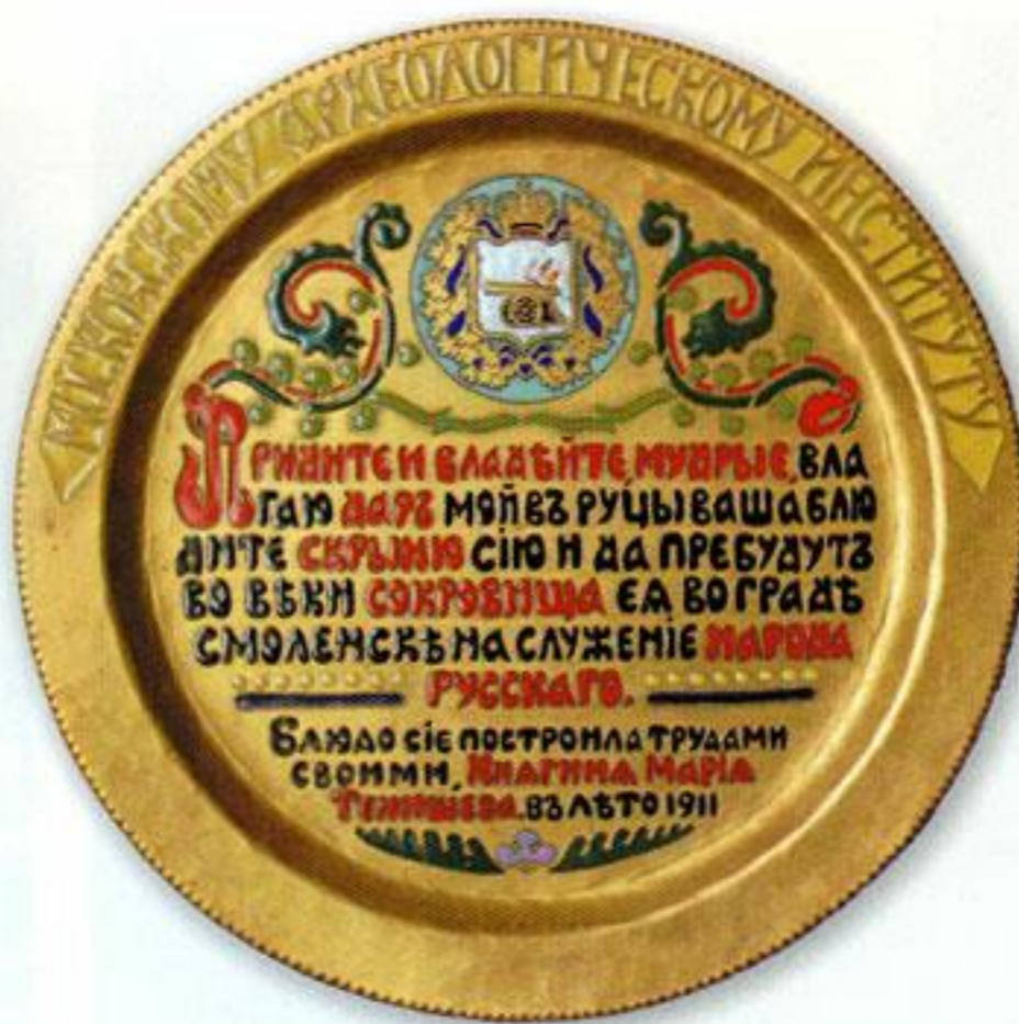
М. К. Тенишева. Блюдо. 1911 г. Париж. Медь, чеканка, выемчатая эмаль.

25 января 1897 года Мария Клавдиевна представила публике своё собрание (520 номеров) на большой выставке в здании общества поощрения художеств на Большой Морской в Петербурге. В создании экспозиции принимал самое активное участие Александр Бенуа. Он же подготовил иллюстрированный каталог