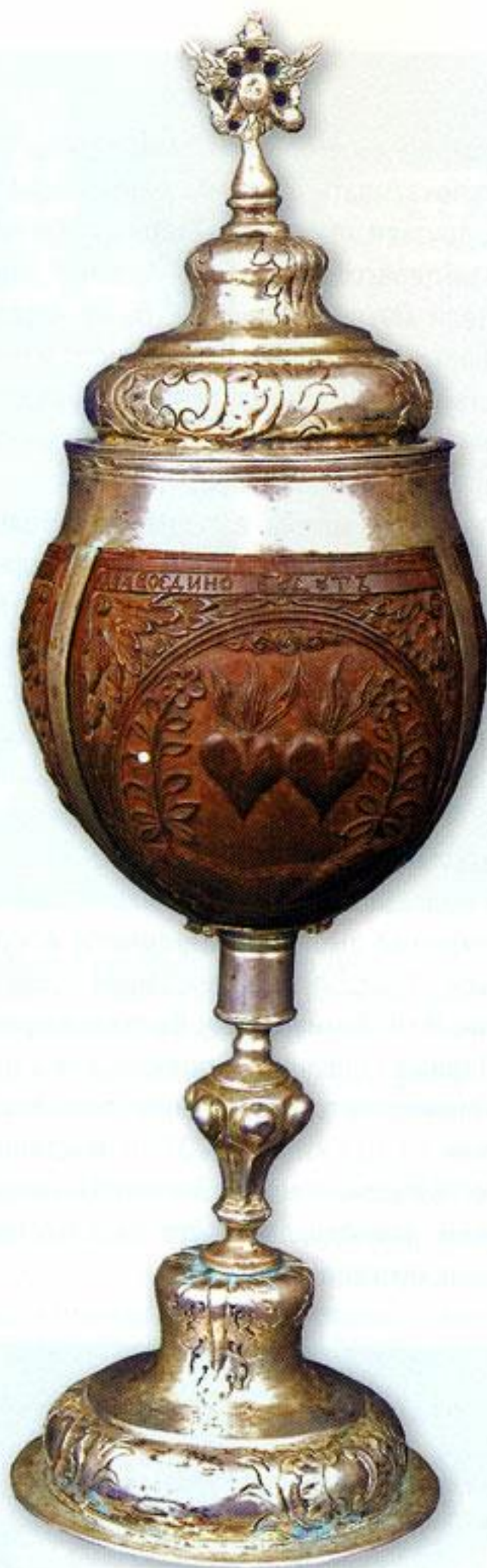
Кубок с крышкой. 1765 г. Москва. Неизвестный мастер. Серебро, кокос, резьба, чеканка, литьё.

Важным источником пополнения собрания служили материалы археологических раскопок. Это были предметы, найденные при раскопках городищ и курганов на Смоленской земле. Тени-