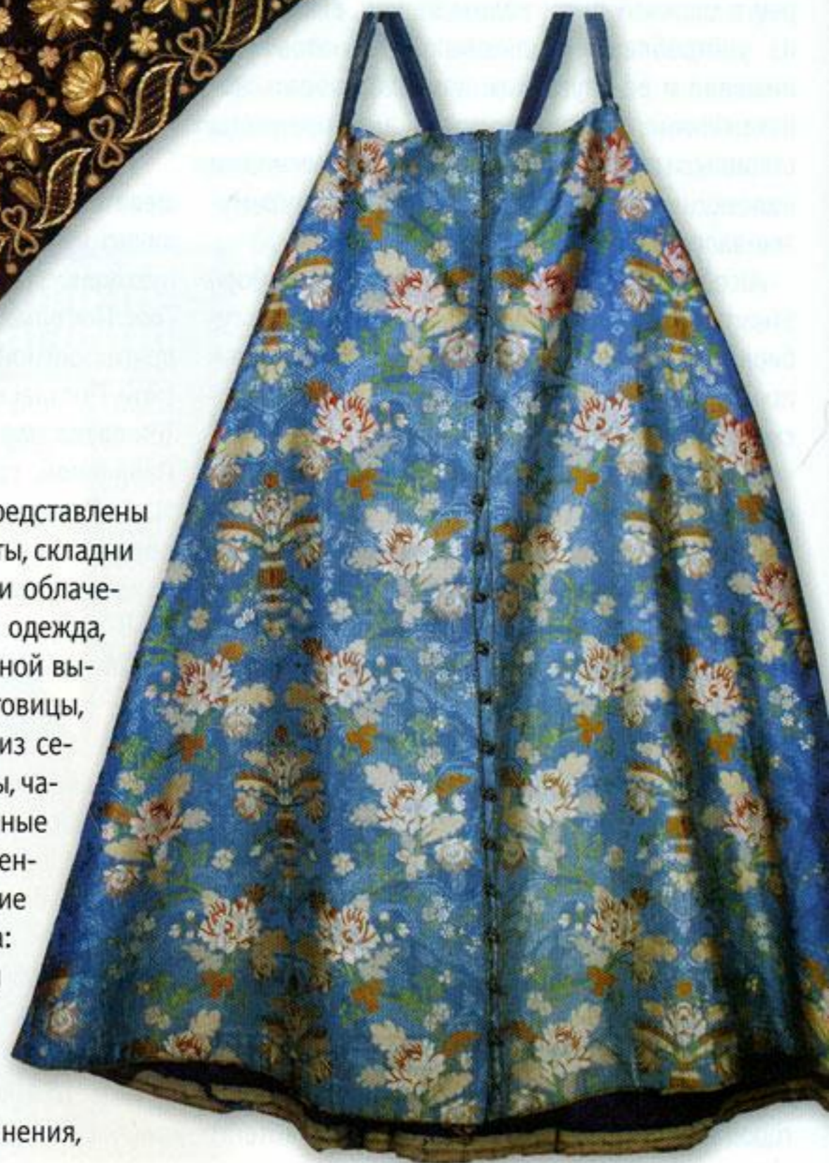
Сарафан. XVIII в. Россия. Шёлк, холст, серебряные пуговицы.

На выставке были широко представлены культовые предметы: иконы, кресты, складни XIII–XVIII веков, шитые пелены и облачения. Имелись также крестьянская одежда, кружево, головные уборы с золотной вышивкой и жемчугом; серьги, пуговицы, бисерные украшения; предметы из серебра, меди, олова: кубки, братины, чаши, чарочки; предметы, украшенные эмалью; наградные ковши. Особенно поразили зрителей крестьянские предметы домашнего обихода: ковши, енды, скобкари, вальки для белья, рубели, прялки, донца.