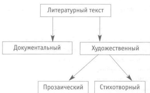
Рис. 2. Разновидности литературного текста.

Использование стихотворений на уроках географии полезно и необходимо. Правильно и удачно подобранные стихи ярко раскрывают образ территории и отражают в сжатом виде содержание темы, имеют патриотическую окраску. Анализ стихотворений знаком учащимся по урокам родной речи и литературы, где формировался общий навык анализа. Используя стихи, учитель географии продолжает формирование этого навыка на своих уроках уже в географическом аспекте, формирует литературно-географический взгляд, полезный в жизни.