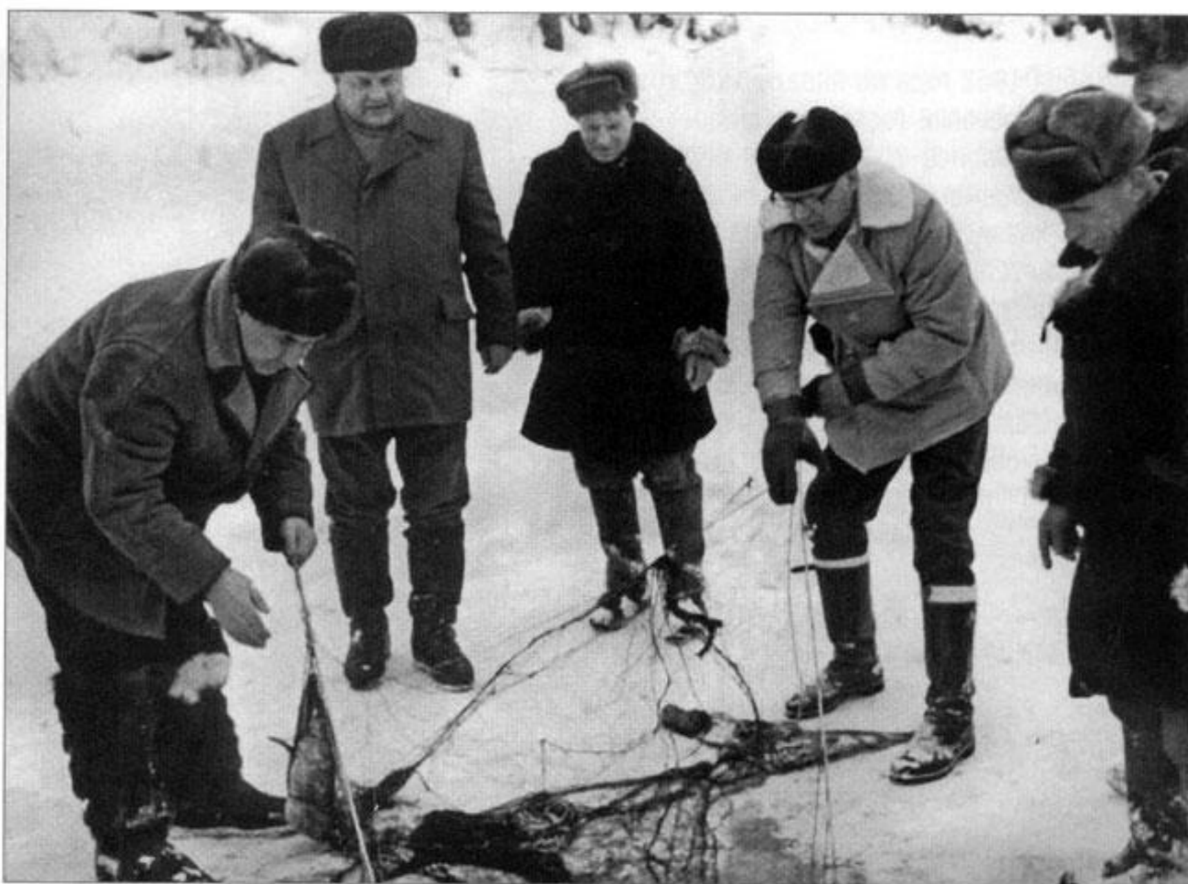
А. Н. Косыгин и У. К. Кекконен на зимней рыбалке.

...Зимний день в Подмосковье короток, и когда мы с егерями подвезли трофеи к охотничьему костру, уже совсем стемнело. Начальник хозяйства сообщил Н. С. Хрущёву и гостю, что добытый Урхо Кекконеном зверь — лось. Президент переспросил меня: «Точно лось?» «Да», — ответил я и предложил