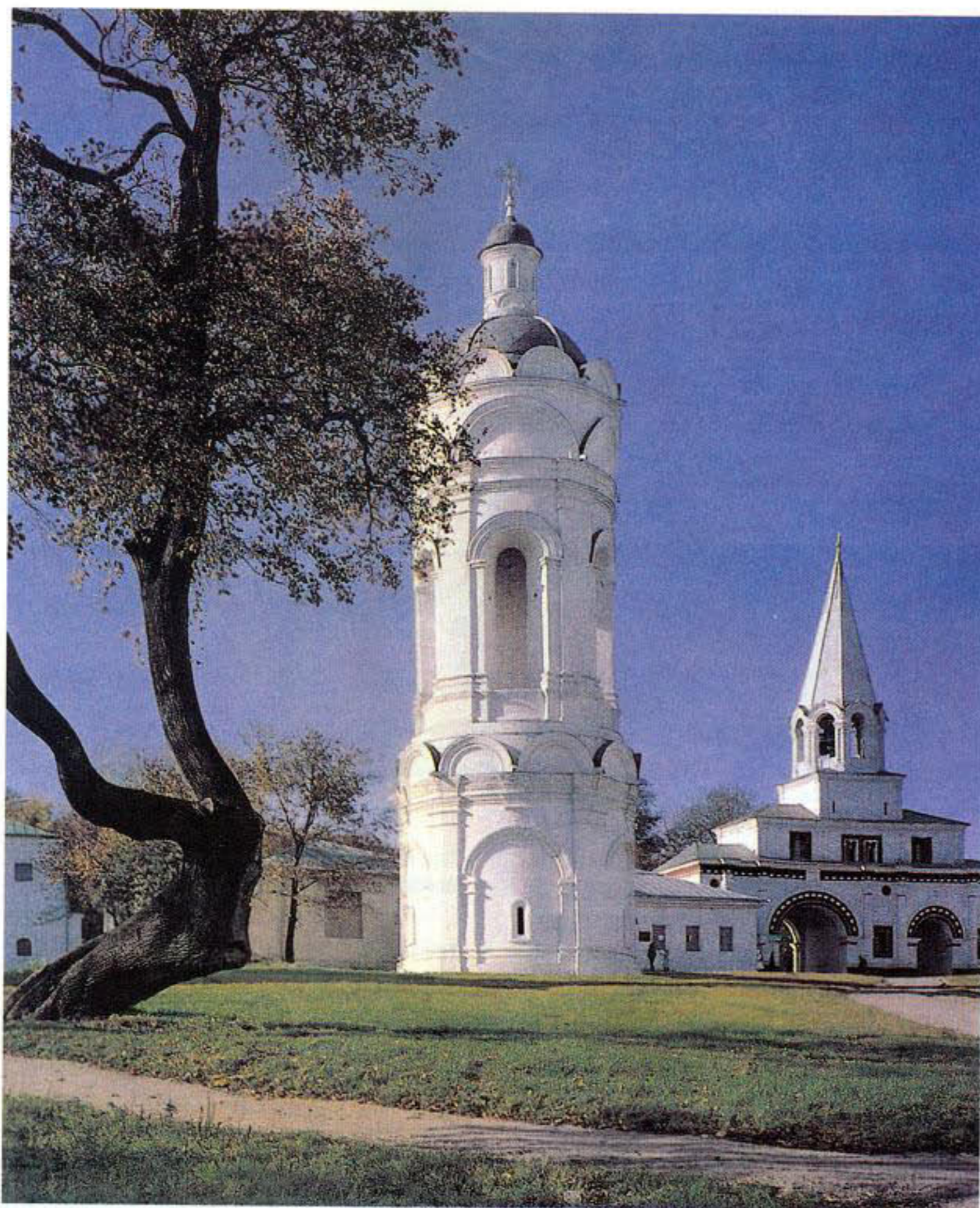
Георгиевская колокольня XVI в. и Передние ворота с часовой башней.

ников. Таким памятником торжества идеи божественной России, особого покровительства, благословения верховной власти стала церковь Вознесения Господня. По-разному воспринимается великолепное здание: одним оно напоминает башню, другим — сооружение в готическом стиле, третьим — стрелу, устремленную в небо. Но можно представить его «обетной» свечой, которую заказчик — великий князь — поставил во имя исполнения горячей молитвы правителя и человека.