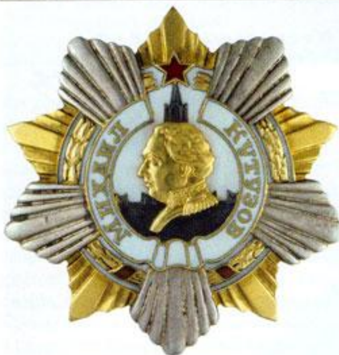
Орден Кутузова 1-й степени.

Председатель Президиума Верховного Совета СССР (М. Калинин)