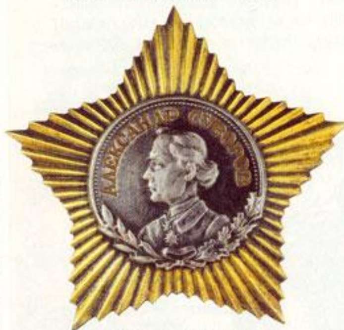
Орден Суворова 2-й степени.