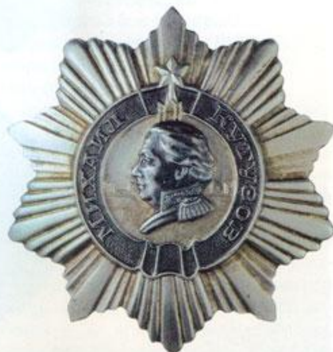
Орден Кутузова 3-й степени.

Установить две степени ордена: первой степени — из золота и второй степени — из