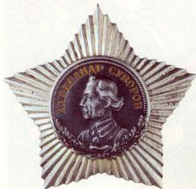
Орден Суворова 3-й степени.

ми на лучах большой платиновой звезды, и с пятью большими эмалевыми лучами. Однако остановились на платиновой звезде с золотым медальоном на тёмно-сером поле.