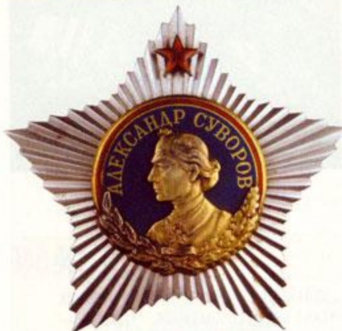
Орден Суворова 1-й степени.

Но работа над орденом продолжалась ещё долго. Художник сделал несколько новых рисунков, которые были переведены в металл. Знак ордена Суворова I степени должны были изготавливать из платины. Центральный медальон с портретом, чеканившийся из золота, художнику пришлось несколько раз рисовать заново. Известны и пробные образцы в металле, на которых медальон полностью золотой, а также варианты, где поле медальона залито то белой, то зелёной эмалью. Рассматривали образцы и с пятью маленькими эмалевыми звёздочка-