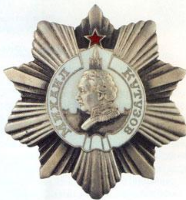
Орден Кутузова 2-й степени.

тиконечной звезды с серпом и молотом в центре, на одном — силуэт Кремлёвской стены с башней, на шпигеле которой — красная пятиконечная звезда, а на фоне стены и башни — «серп и молот»