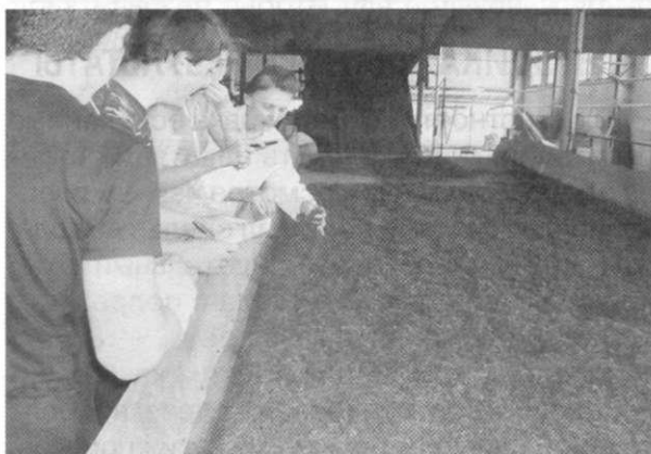
Рис. 3. На чайной фабрике

Заключительным процессом производства чая является сортировка сухого чая-полуфабриката, т.е. подбор с помощью различных номеров сит (сортировочных машин); однородных по размерам и форме чаинок.