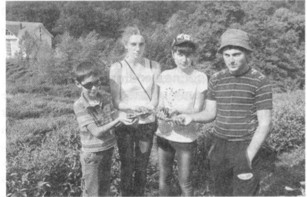
Рис. 2. Школьники — члены исследовательской группы