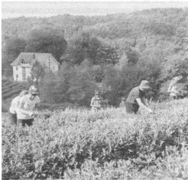
Рис. 1. На чайной плантации