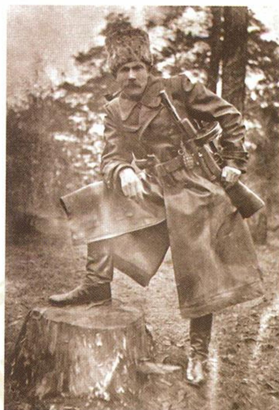
Т. Бульба-Боровец. 1942 год

В ведение комитета, образованного 27 сентября 1942 года, перешли торгово-промышленные предприятия и открытое ранее при городском управлении Бюро помощи украинскому населению [4]. Первоначально он состоял из председателя и пяти членов. Руководство старалось объединить всех «сознательных украинцев», однако столкнулось с вполне объяснимыми трудностями. Украинцев в Крыму было мало, а тех, кто поддерживал комитет, — ещё меньше. Чтобы подстегнуть процесс «украинизации», лидеры комитета открыли специальный «украинский магазин» и объявили, что «только украинцам будут выдавать муку и другие продукты» [6, л. 3]. Как писал очевидец событий, «из-за этого в украинцы записывались люди, которые сами и отцы которых никогда не видели земель Украины и которым при других обстоятельствах и в го-