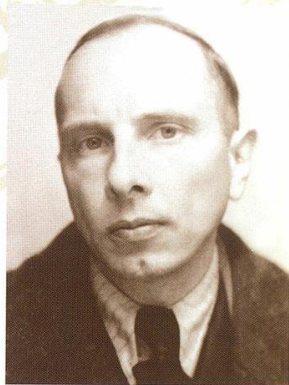
С. А. Бандера. Послевоенная фотография

И бандеровцы, и мельниковцы сформировали свои «Южные походные группы ОУН». Мельниковская смогла дойти только до Николаева, а