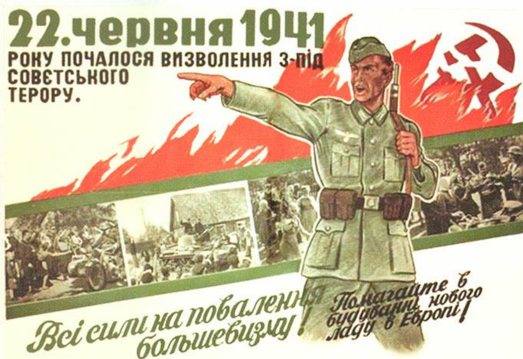
Пропагандистский плакат ОУН 1941 года

«Подвиги» украинских националистических организаций в годы Второй мировой войны общеизвестны, чего не скажешь об их попытках распространить свое влияние на Крым. В их среде бытовало вполне обоснованное мнение: «Только тот, кто будет господином Крыма и будет иметь свободный путь через Босфорские ворота к мировым путям, тот будет хозяином Чёрного моря и юга Восточной Европы» [14, с. 186]. Воодушевлял их и главный нацистский идеолог А. Розенберг, который весьма высоко оценивал антикоммунистический потенциал украинцев и планировал сделать Крым частью «Великой Украины». Так что экспедиция на полуостров стала любимым пропагандистским проектом националистов, и с началом войны они попытались его реализовать.