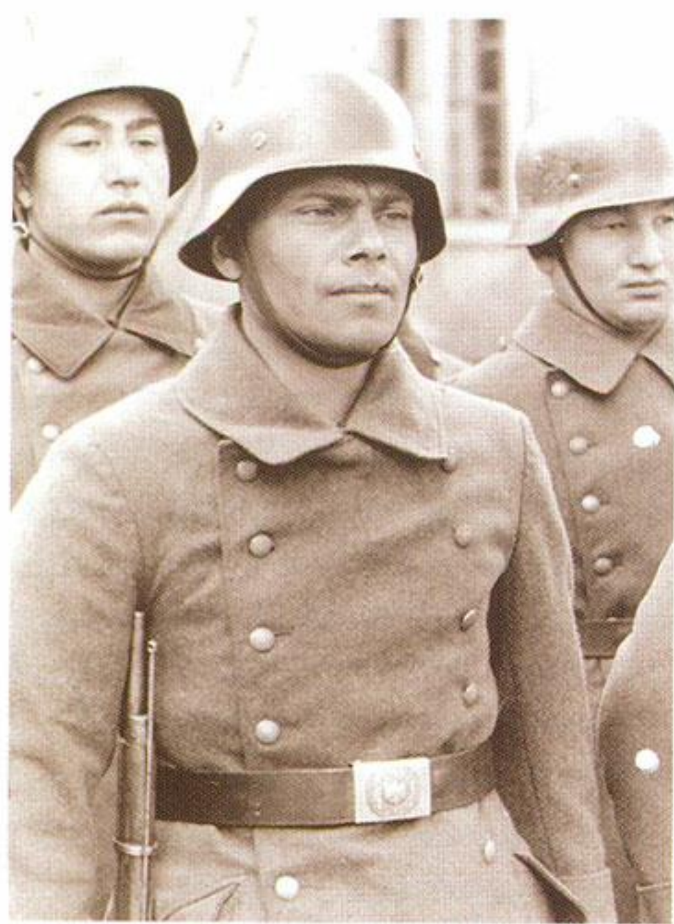
Добровольцы одного из тюркских формирований вермахта

Подтвердилась старая истина: украинские националисты проявляли «смелость» только тогда, когда за их спиной стояли хозяева, будь то в расправах с мирными жителями или в охране концлагерей. Немцы же преследовали любые организации, даже антибольшевистские, если