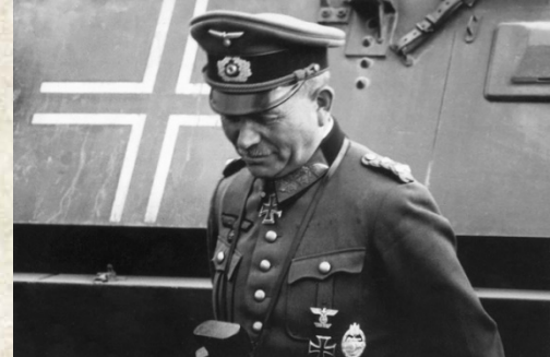
Гайнц Вильгельм Гудериан — генерал-полковник германской армии, генерал-инспектор бронетанковых войск

Из воспоминаний Г. Гудериана: «Полевой штаб мы устроили в Ясной Поляне, в поместье графа Толстого. Ясная Поляна находилась непосредственно за штабом пехотного полка «Великая Германия», в шести километрах к югу от Тулы. В поместье было два пригодных для жилья дома, «замок» и «музей», выполненных в стиле загородной усадьбы конца XIX века; кроме них, было много хозяйственных построек. Я приказал оставить «замок» в полном распоряжении семьи Толстых».