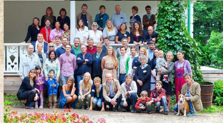
Международный съезд семьи Толстых в 2018 году