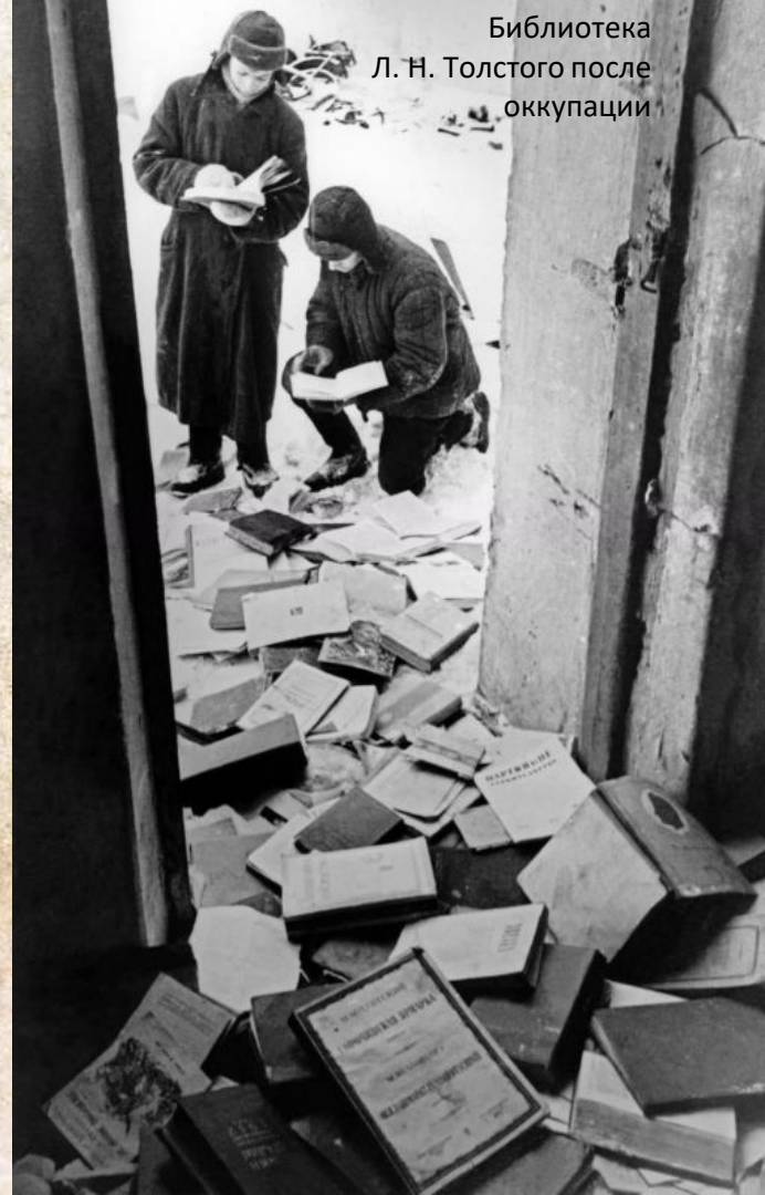
Библиотека Л. Н. Толстого после оккупации

200 вражеских мин и снарядов было обезврежено на территории усадьбы после ее освобождения.