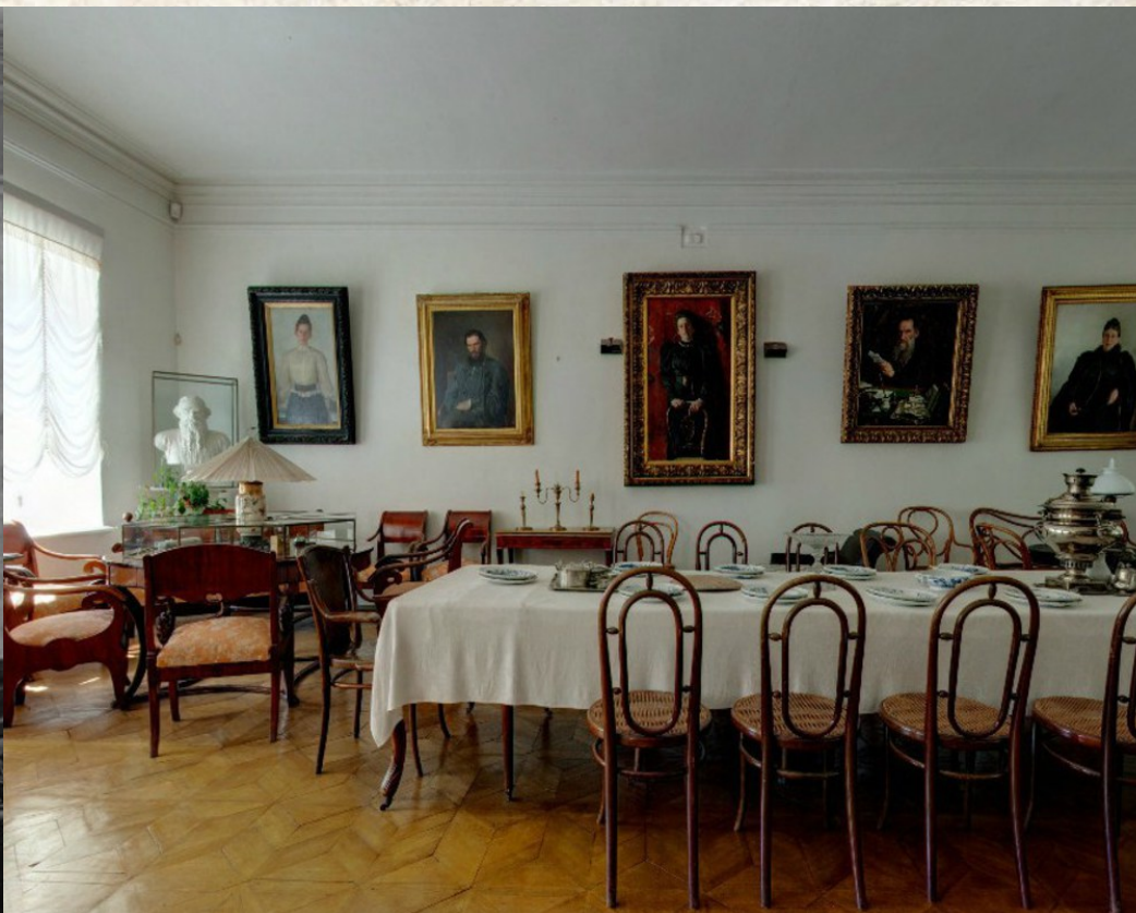
Столовая музея-усадьбы «Ясная поляна» после освобождения от немецкой оккупации и в наши дни