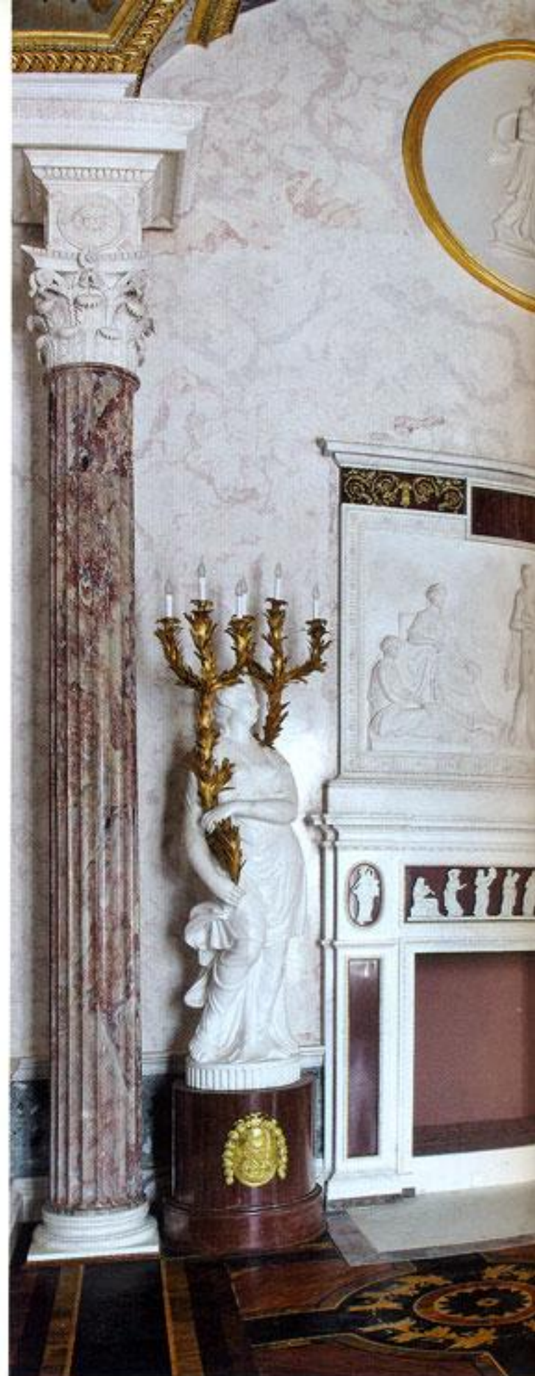
Панорама Большого зала

Весной 1783 года Ч. Камерон получил указание императрицы подготовить проект отделки комнат второго этажа Холодной бани яшмой и предложил ей рисунки двух кабинетов. Стены покрывались известняковыми плитами, облицованными цветной уральской и алтайской яшмой. Её обработка достигла совершенства, хотя шлифовка и полировка, призванные выявить яркость красок и сочность тонов, представляли немалую трудность. До стеклянного блеска следовало вручную довести около двухсот квадратных метров стен, наличников и карнизов. Облицовка выполнялась пластинами уразовской яшмы тёмно-красного цвета с вкраплением белого кварцита. В XVIII веке её называли «мяс-