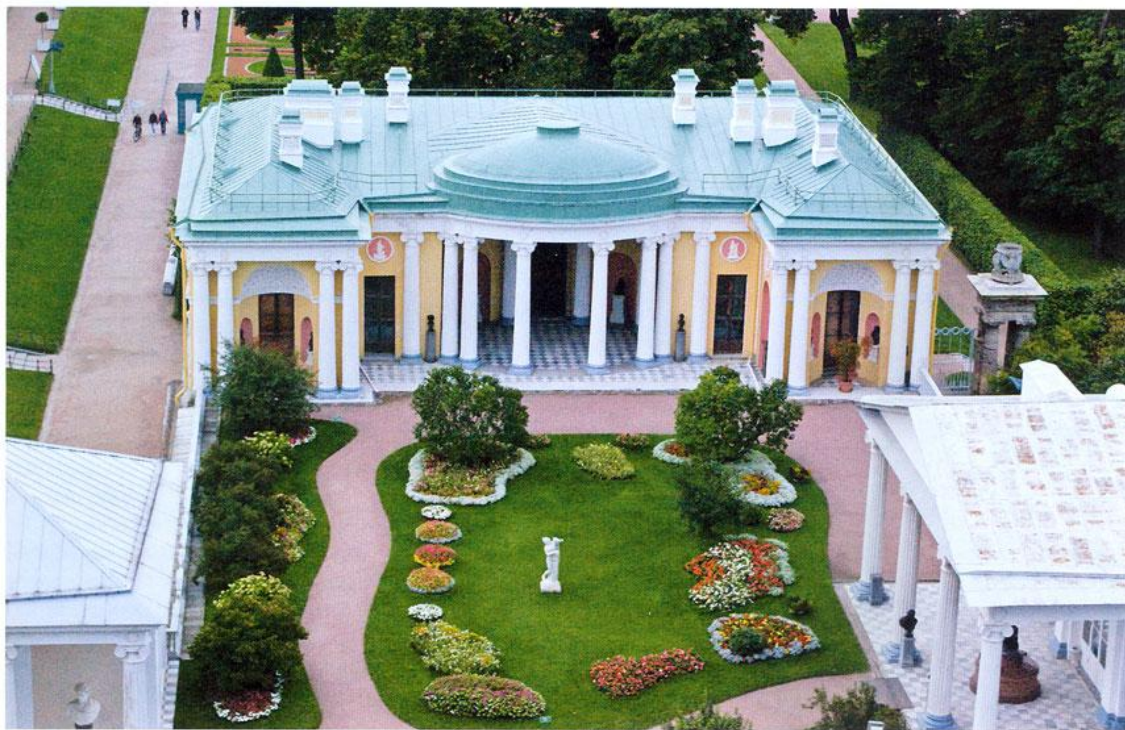
Камеронова галерея и павильон «Холодная баня»

В нижнем этаже размещались Передняя, Отдыхальная, Купальный зал с холодным бассейном, Ванная комната с тёплой ванной, Угловой кабинет и Русская баня. Интерьеры оформлены колоннами искусственного мрамора, медальонами и рельефными фризами. Верхний этаж предназначался для отдыха. Агатовые комнаты сделались излюбленным местом Екатерины II, где в ранние утренние часы она занималась просмотром государственных