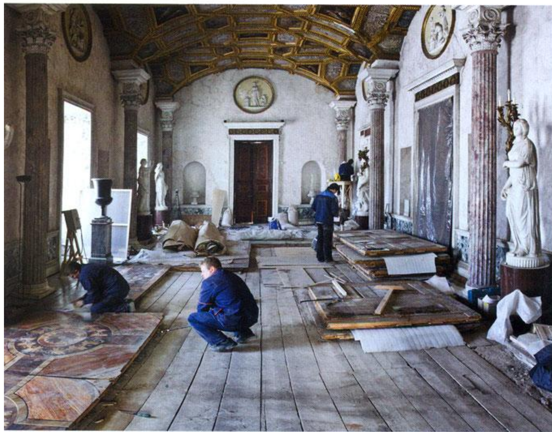
Снятие паркета в Большом зале

ным агатом», отчего интерьеры и получили название Агатových комнат.