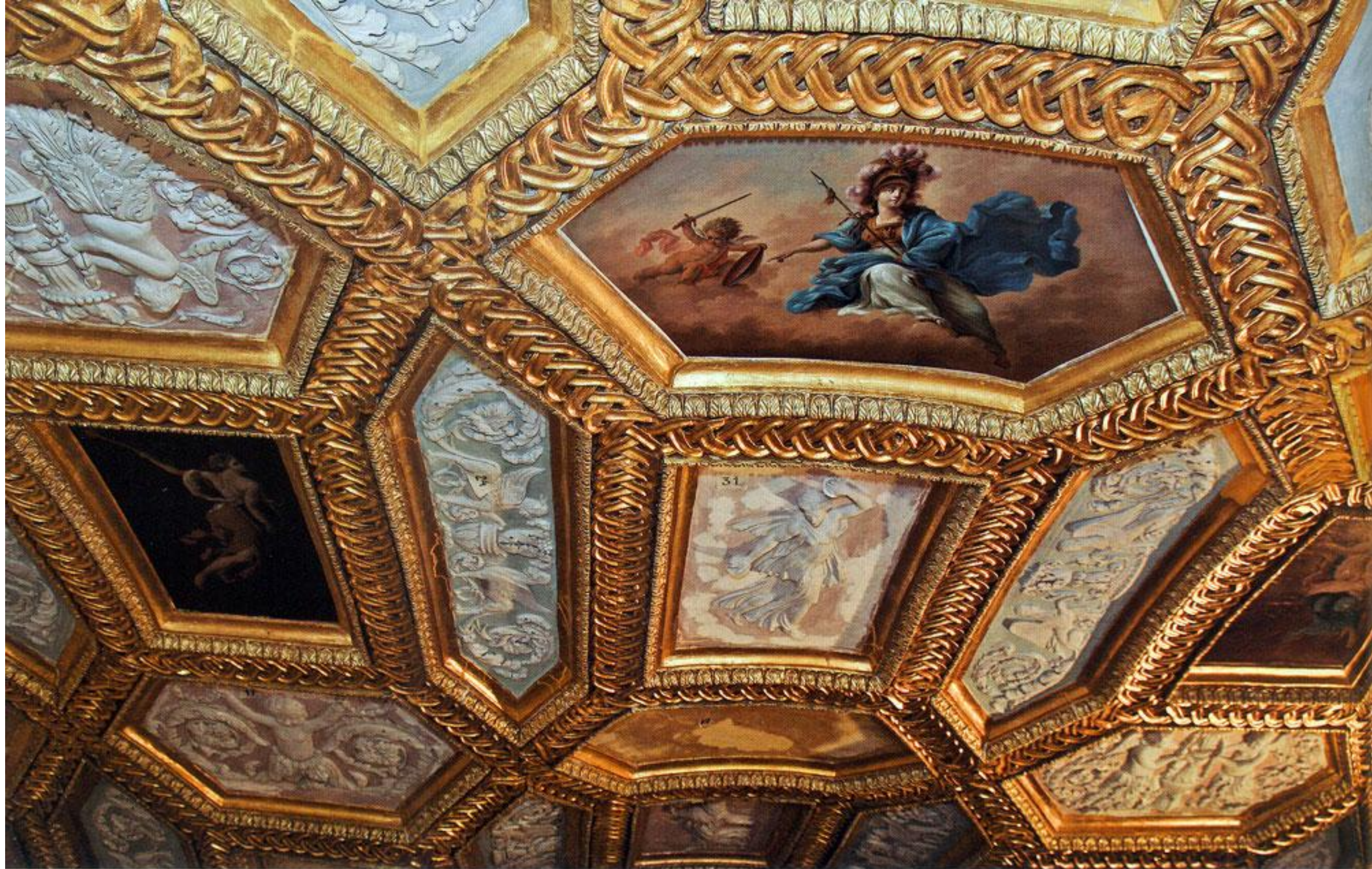
Фрагмент плафона Большого зала после реставрации

удаляли поздние записи. Утраченные фрагменты восполнили тонировками.