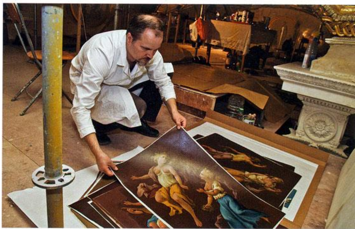
Живописные вставки с потолка Большого зала

Основной элемент убранства Агатového и Яшмового кабинетов — это, разумеется, яшмовая облицовка стен, каминов и массивных дверей. Предстояло укрепить осыпающиеся и отслаивающиеся фрагменты, воссоздать многочисленные утраты мозаичного набора, провести окончательную отделку с нанесением глянца. При восполне-