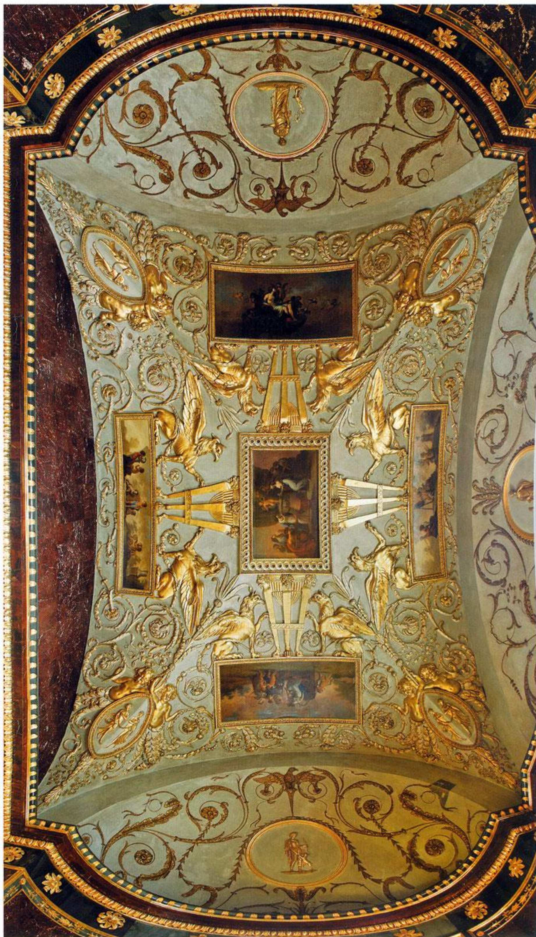
Потолок Агатового кабинета

В плафоны Агатовых комнат вмонтировано восемьдесят пять живописных вставок, выполненных маслом. Их основа — тряпичная бумага «верже» ручного отлива — отстала от перекрытий и деформировалась, грозя обрушением хрупких композиций. Грунт, а кое-где и красочный слой местами разложились. Авторская живопись участками находилась под разновременными поздними записями. Для восстановления оригиналов бумажный лист дублировали на слой японской бумаги. Живописную поверхность очищали от загрязнений, выравнивали покрывной лак,